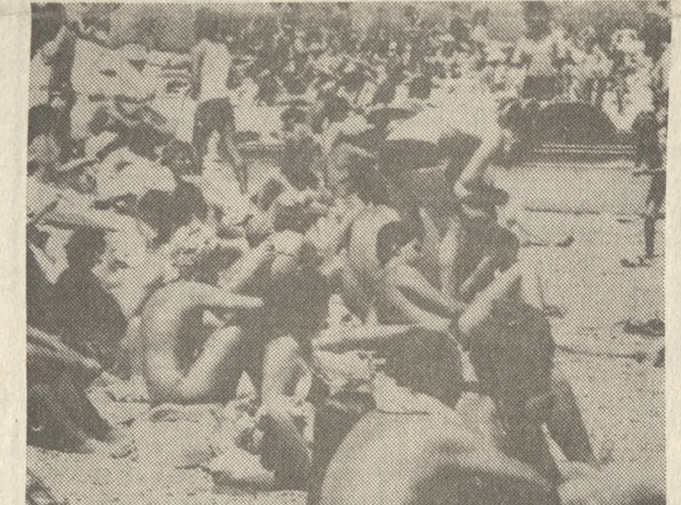
Θα μας έρθουν περισσότεροι ξένοι εφέτος στην Κρήτη;

Την οργανωτική ευθύνη της έκθεσης που θα διαρκέσει εννέα