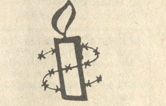
αμερικανικά ομήματα. Επίσης πρέπει να γίνουν προσπάθειες για την πληροφορηση των πολιτών για τα δικαιώματά

τους και για τους τρόπους και τα μέσα που τους παραβιάζουν και να καταγγέλουν τις παραβιάσεις. Η ενίσχυση της κυβερνητικής δέσμευσής σ' αυτά τα μέτρα αυξάνει και την προστασία των ίδιων των αγωνιστών των ανθρωπίνων δικαιωμάτων. Η ΔΑ αντιμετωπίζει τις παραβιάσεις κατά των αγωνιστών των ανθρωπίνων δικαιωμάτων και άλλων ατόμων διδιδοτάς πληροφορίες για παραβιάσεις και αποδείξεις για παραβιάσεις που συμβαίνουν σήμερα. Η οργάνωση προκαλεί τις κυβερνήσεις που επιχειρούν να αποκρίψουν τα γεγονότα και να φημισούν αυτούς που τις κρίνουν. Η εκστρατεία της ΔΑ το 1988 θα γίνει μέσα στο κλίμα αλλαγής που δημιουργήθηκε από τις 1.000 και πάνω ανεξάρτητες ομάδες ανθρωπίνων δικαιωμάτων στον κόσμο. Οι προσπάθειές τους έχουν εντείνει το αίτημα του κοινού προς τις κυβερνήσεις να σεσαστούν τις υποχρεώσεις τους προς τα ανθρώπινα δικαιώματα. Νομικοί και ιατρικοί σύλλογοι, θρησκευτικές ομάδες, συνδικάτα και άλλοι οργανισμοί θα συμπράξουν με τη ΔΑ στην εκστρατεία αυτή δουλεύοντας με τα μέλη της ΔΑ και τους υποστηρικτές της σε 150 χώρες. Όλοι μαζί θα εργαστούν για τον κοινό στόχο, να γίνουν τα ανθρώπινα δικαιώματα πραγματικότητα στη ζωή όλων των ανθρωπίνων. ΣΗΜΕΡΑ.