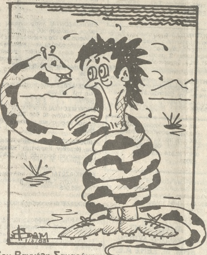
Του Βαγγέλη Σαμαράκη