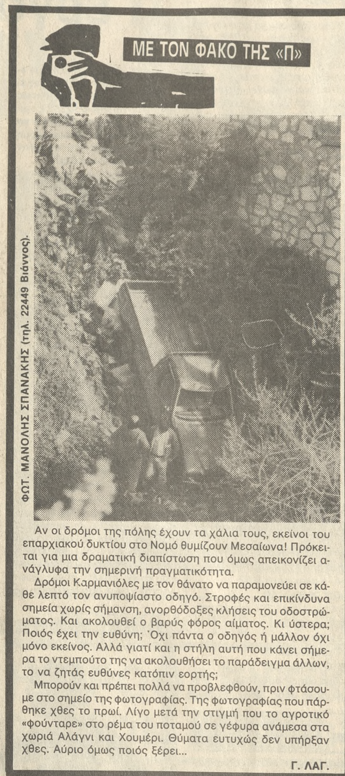
ΜΕ ΤΟΝ ΦΑΚΟ ΤΗΣ «Π»

Κοινή ήταν η διαπίστωση των αντιπροσώπων στη Γενική Συνέλευση ότι τα προβλήματα του επαγγελματικού ωραρίου των επαγγελματιών δεν βρήκαν την λύση τους παρά τις κάποιες βελτιώσεις που έγιναν τα τελευταία χρόνια. Αντίθετα τονίστηκε ότι πολλά από τα προβλήματα αυτά οδηγούντα καθημερινά όλο και περισσότερο. Στην σχετική απόφαση της Γενικής Συνέλευσης των αντιπροσώπων αναφέρεται: Η Γ.Σ. αποφάσισε ομόφωνα να ακολουθήσουμε την ΓΣΕΒΕ στην απόφαση της για κινητοποίηση στις 10 Μαρτίου και να κλείσουμε τα μαγαζιά και τα εργαστήρια μας στο Ηράκλειο την μέρα αυτή. Καλούμε όλους τους συναδέλφους επαγγελματίες-βιοτέχνες-εμπόρους του Νομού να αγωνιστούμε όλοι μαζί για να λύσουμε