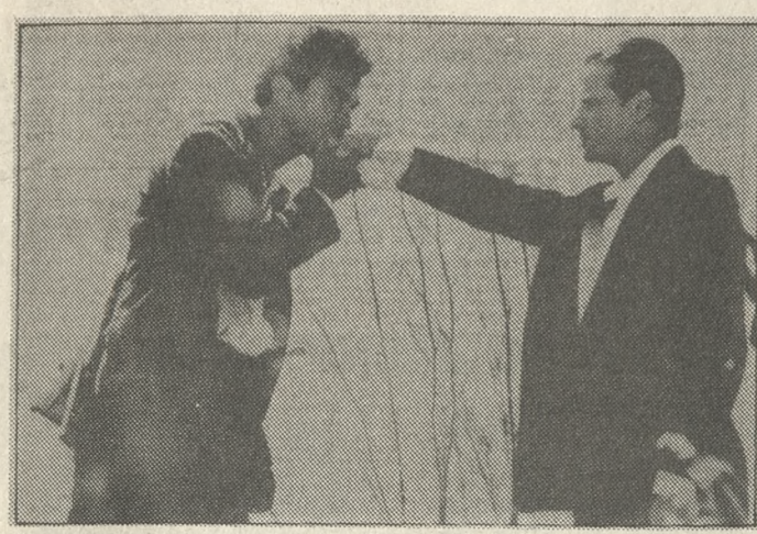
Σκηνή από την ταινία του Μάικλ Τσιμίνο «Ο Σικελός»

• ΑΡΚΕΤΕΣ επαναλήψεις έχουμε στο πρώτο μέρος της εβδομάδας αυτής. Πάντως πρόκειται για εξιόλογες ταινίες και μπορεί ευχάριστα να τις παρακολουθήσουν ακόμη και οι θεατές που τις είδαν στην πρώτη προβολή.