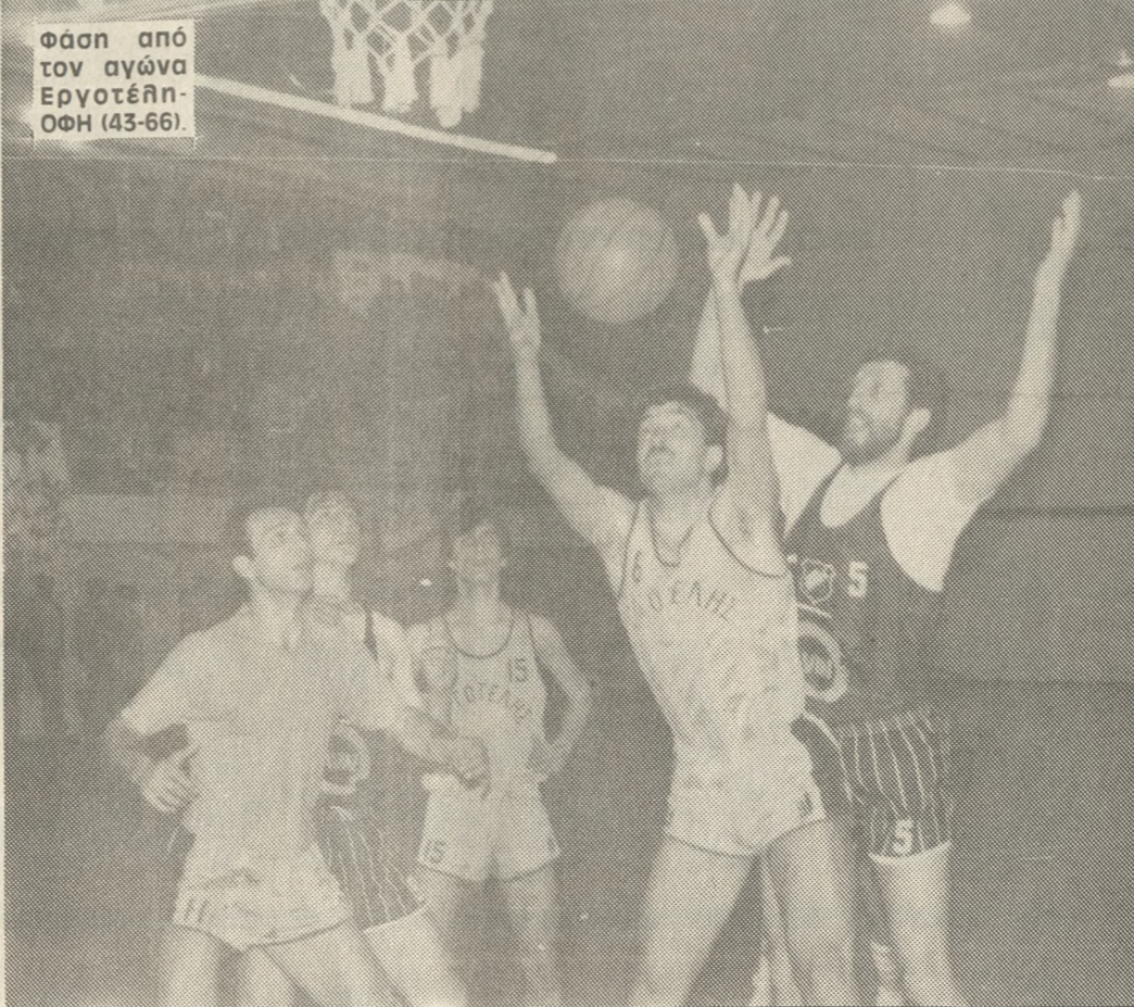
Φάση από τον αγώνα Εργοτέλη-ΟΦΗ (43-66).