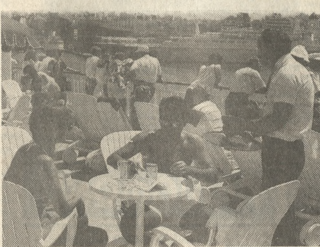
Περισσότεροι Γερμανοί τουρίστες περιμένουμε το καλοκαίρι.

Η αισιόδοξη αυτή δήλωση έγινε από τον υφυπουργό Εθνικής Οικονομίας αρμόδιο για θέματα τουρισμού κ. Νίκο Σκουλά στη διάρκεια συνέντευξης Τύπου που έδωσε χθές με τον