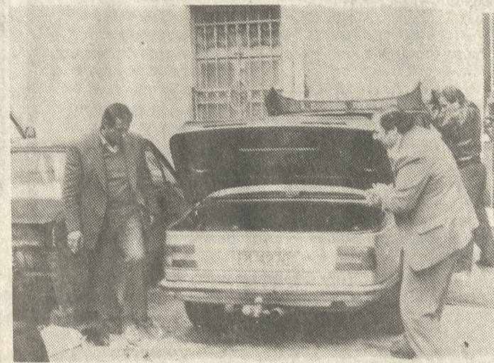
Αξιωματικοί της Ασφάλειας ερευνούν το Μπε-Εμ-Βε χθές το μεσημέρι.