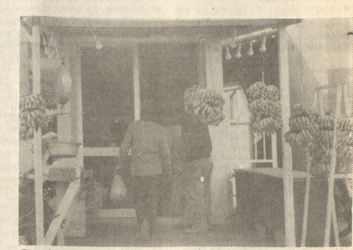
Θα πάρουν μέτρα προστασίας των μπιανανοπαγωγών ρωτά ο κ. Δρεττάκης.

ΑΝΑΚΟΙΝΩΣΗ Από Δευτέρα 15 Μαρτίου Ξεκινάμε νέο γκρουπ ΑΕΡΟΒΙΚ ειδικά για ΑΔΥΝΑΤΙΣΜΑ, με ειδικευμένο άτομο στο συγκεκριμένο είδος προγράμματος. ΩΡΕΣ ΛΕΙΤΟΥΡΓΙΑΣ ΤΟΥ ΓΥΜΝΑΣΤΗΡΙΟΥ ΔΕΥΤΕΡΑ έως ΠΑΡΑΣΚΕΥΗ 9 π.μ. έως 9 π.μ. ΣΑΒΒΑΤΟ 9 π.μ. έως 4 π.μ. Οδός Μεραμβέλλου 12 (Όπισθεν Λυκείου «ΚΟΡΑΗ») Πληροφορίες - εγγραφές εντός.