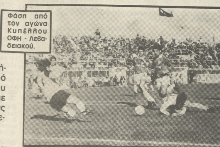
Φάση από τον αγώνα Κυπέλλου ΟΦΗ - Λεβαδειάκ.

• ΑΥΡΙΟ 24η αγωνιστική ημέρα του πρωταθλήματος Α' Εθνικής, ο ΟΦΗ αγωνίζεται στο γήπεδό του με τον Λεβαδειάκ. Μοναδικός στόχος του Ηρακλειώτικου συγκροτήματος είναι η νίκη, με την οποία θα προσθέσει στο ενεργητικό του τους δύο βαθμούς και θα εξακολουθήσει να βρίσκεται πολύ κοντά στην διακρίση.