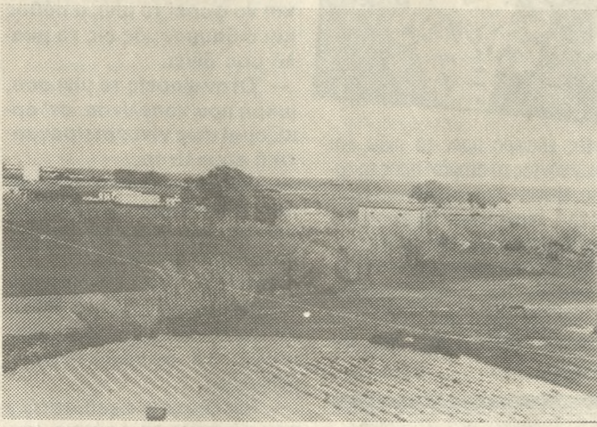
Ο χώρος του κάμπινγκ η δημιουργία του οποίου προκαλεί αντιπαράθεση Δήμου και Κοινοτήτων

Νέα όξυνση στις σχέσεις των τριών Κοινοτήτων της περιοχής του Καρτερού (Αλικαρνασσού, Καλλιθέας και Ελιάς) και του Δήμου Ηρακλείου, προέκυψε τις τελευταίες μέρες με αφορμή αυτή τη φορά, την δημιουργία του Κάμπινγκ που οι 4 Οργανισμοί Τοπικής Αυτοδιοίκησης πρόκειται να δημιουργήσουν στην παραλία.