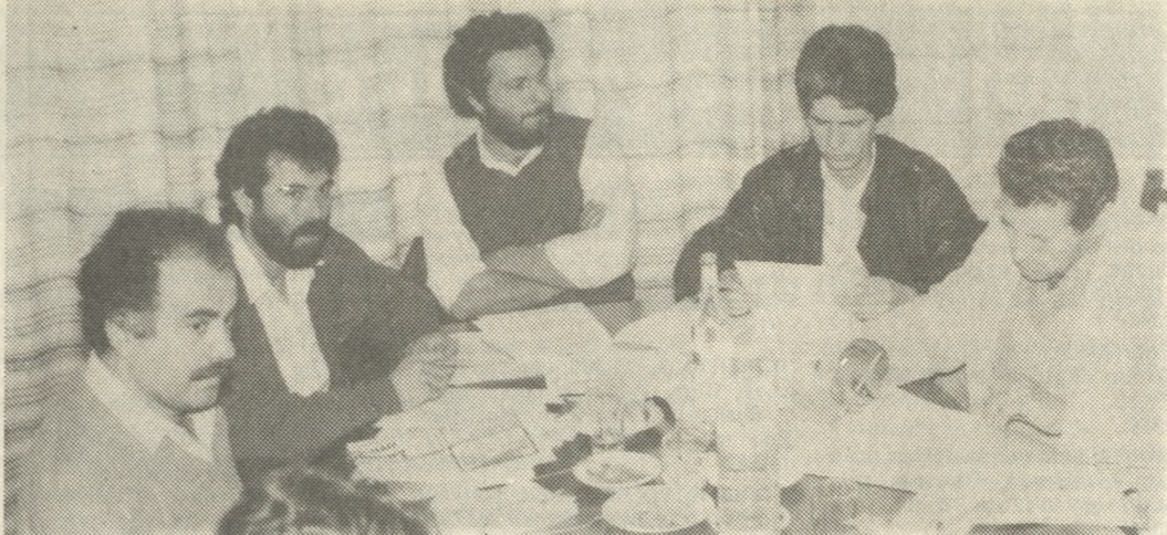
Η διοίκηση του Ε.Κ.Η στη χθεσινή συνέντευξη Τύπου.