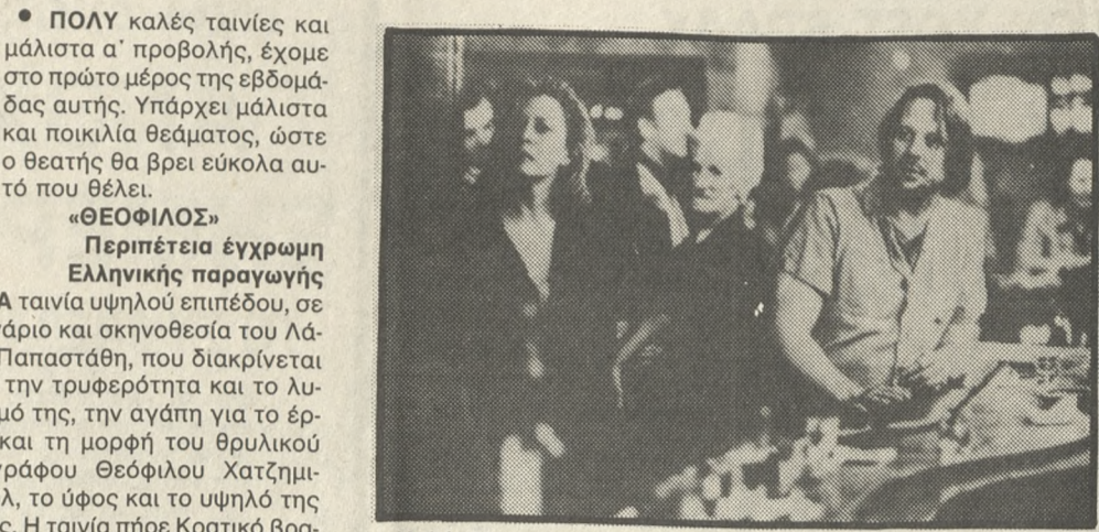
Η Φέι Νταναγούεϊ και ο Μίκι Ρουρκ στην ταινία «Μπαρφλάι»

ΠΟΛΥ καλές ταινίες και μάλιστα α' προβολής, έχουμε στο πρώτο μέρος της εβδομάδας αυτής. Υπάρχει μάλιστα και ποικιλία θέματος, ώστε ο θεατής θα βρει εύκολα αυτό που θέλει. «ΘΕΟΦΙΛΟΣ» Περιπέτεια έγχρωμη Ελληνικής παραγωγής ΜΙΑ ταινία υψηλού επιπέδου, σε σενάριο και σκηνοθεσία του Λάκη Παπαστάθη, που διακρίνεται για την τρυφερότητα και το λυρισμό της, την αγάπη για το έργο και τη μορφή του θρυλικού ζωγράφου Θεόφιλου Χατζημιχαήλ, το ύφος και το υψηλό της ήθος. Η ταινία πήρε Κρατικό βραβείο, ενώ είναι υποψήφια για βραβείο στο Φεστιβάλ Βερολίνου 1988 και προτάθηκε για το φετινό Όσκαρ ξένης ταινίας. Στο φιλμ συνεργάστηκαν με εμπνευσία και δημιουργικό κέφι και οι Θεό. Μάρκας (φωτογραφία), Ιουλίτσα Σταυρίδη (κοστούμα-σκηναία), Βαγ. Γούσκας (μοντάζ), Γ. Παπαδόκης (μουσική). Τον ρόλο του Θεόφιλου ερμηνεύει ο Δημ. Καταλειφός. (ΣΤΟΥΝΤΙΟ)