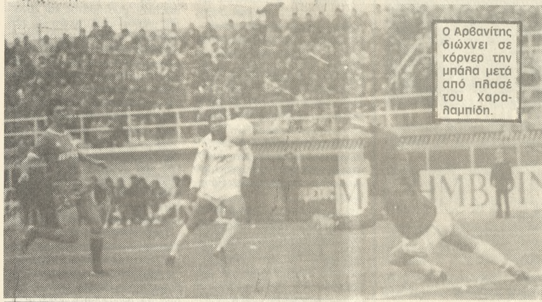
Ο Αρβανίτης δίνει σε κόρνερ την μπαλιά μετά από πλάσέ του Χαλαμπιδή.