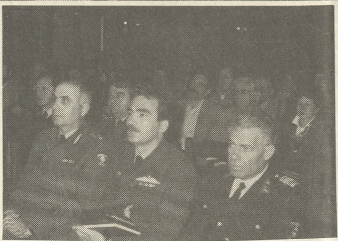
Από την χθεσινή σύσκεψη στην αίθουσα της Βασιλικής του Αγ. Μάρκου...