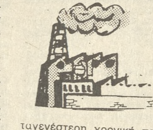
Τα νεότερη χρονική περίοδο καλύπτει το 30%.