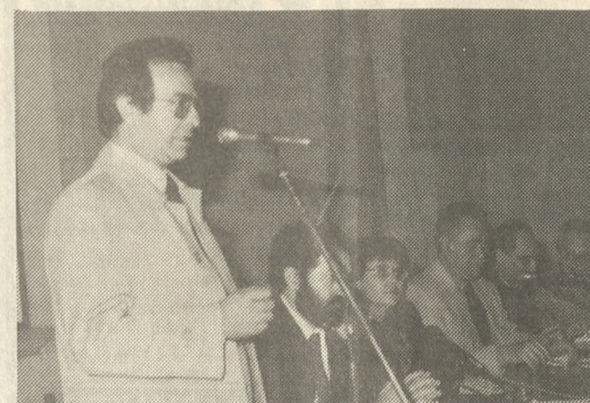
Ο αναπληρωτής Υπουργός ΠΕΧΩΔΕ στην χθεσινή σύσκεψη για τον αντισεισμικό σχεδιασμό της πόλης.

Την έναρξη των εργασιών της χθεσινής σύσκεψης κήρυξε ο αναπληρωτής υπουργός Περιβάλλοντος Χωροταξίας και Δημοσίων Έργων κ. Μανώλης Παπαστεφανάκης ο οποίος με-