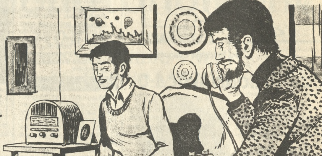
— Το μόνο που άκουσα ήταν ότι τηλεφωνούσε σε κάποιον στο Σικάγο.

Από τί, έρευνες που έκανα ο ίδιος, οδηγήθηκα στο συμπέρασμα ότι ο διαρρηχτής τρύπησε από το στενό παράθυρο κάποιας τουαλέτας για να μπει στο κτίριο. Ύστερα, πέρασε σκυφτά κάτω από τα φωτοηλεκτρικά κύτταρα του συστήματος συναγερμού. Και είναι σαν να άφησε ολοκάθαρη την υπογραφή του ότι αυτός έκανε τη διάρρηξη. — Αλλάχί, η εννοεί; ρώτησε ο Φόστερ. Δε σε καταλαβαίνω. — Ενωσά ότι μονάχα ένας από όλο τον υπόκομο της Νέας Υόρκης μπορούσε να το κάνει αυτό. — Και ποιος είναι αυτός; — Ο Σκίν! απάντησε ήσυχα ο Καρντόνα. Τον λέμε και 'Ισκιο, γιατί είναι τόσο αδύνατος που μπορεί να περάσει ανάμεσα σε δυο κάγκελα. — Τότε, γιατί δεν τον πιάνουμε; ρώτησε ο αρχηγός. — Ήδη τον έχουμε εντοπίσει σ' ένα μπαρ και σε λίγο θα μας τον φέρουν εδώ. Ωστόσο, ο Σκίν, παρ' όλο που παραδέχτηκε ότι αυτός έβαλε στο χέρι τα τρία γραμματόσημα, δεν ήθελε πολλά πράγματα για τον άνθρωπο που του είχε αναθέσει να τα κλέψει, για λογαριασμό ενός πλελτή του. — Το μόνο που άκουσα, ήταν ότι τηλεφωνούσε σε κάποιον στο Σικάγο, κατέληξε ο Σκίν που ήταν θυμωμένος γιατί ο άνθρωπος που του είχε αναθέσει τη δουλειά, του είχε δώσει τα μισά λεφτά από όσα είχαν συμφωνήσει. — Μήπως πήρε το αυτί σου το όνομα αυτού που μιλούσε από το Σικάγο; — Ο Σκίν φάνηκε για μια στιγμή να σκέφτεται και τελικά το κοκαλιάρικο πρόσωπό του φωτίστηκε. — Ναι, φώναξε. Τον αποκαλούσε Μίλερ ή κάπως έτσι.