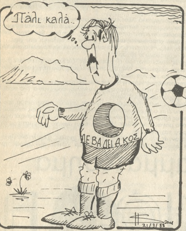
Του Βαγγέλη Σαμαράκη