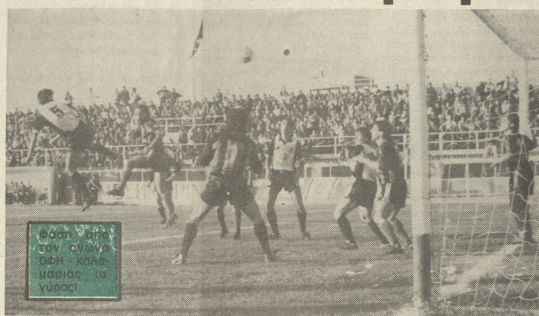
Φόση πριν τον αγώνα ΟΦΗ-Κορυμναίων (α' γύρος).

• ΤΗΝ Κυριακή αρχίζει, από την Καλαμαριά, ένα καυτό οκταήμερο για τον ΟΦΗ, στην διάρκεια του οποίου ίσως κριθούν πολλά σχετικά με την πορεία του στο πρωτάθλημα και στο Κύπελλο.