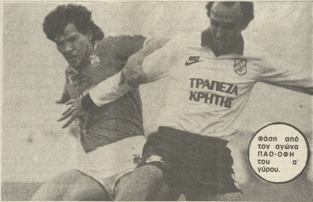
Φάση από τον αγώνα ΠΑΟ-ΟΦΗ του α' γύρου.

...που θα χάσει θα είναι δύσκολο να πετύχει τον στόχο αυτό. Πάντως είμαστε δύο βαθμούς μπροστά από τον ΠΑΟ και παίζουμε στο Ηράκλειο. Εμείς πρέπει να κερδίσουμε την Κυριακή».