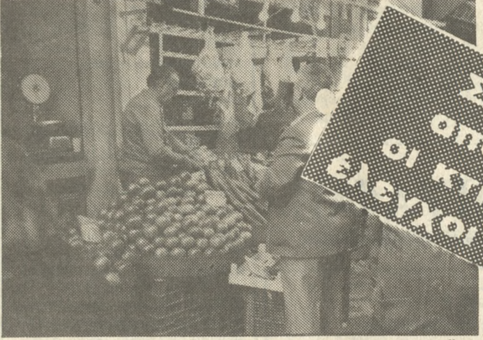
στην χώρα μας αρρώστιας. ΚΑΝΕΝΑ ΠΡΟΒΛΗΜΑ ΣΤΑ ΝΤΟΠΙΑ ΑΜΜΟΡΕΡΦΙΑ Θα πρέπει ωστόσο να επισημαν-

Ήδη από χθες μετά την έναρξη της απεργίας των κτηνίατρων του Δημοσίου οι τοπικοί παράγοντες εκφράζουν φόβους για την λειτουργία της αγοράς σε σχέση με την διακίνηση κρεάτων και αυτό γιατί: • Τα σφαγεία πιθανότατα δεν θα λειτουργούν ή στην καλύτερη περίπτωση η λειτουργία τους θα είναι προβληματική αφού το ελάχιστο προσωπικό ασφαλείας που θα υπάρχει αντικειμενικά δεν θα μπορεί να κάνει τους ελέγχους στα ζώα που θα σφάζονται. • Προβλήματα θα δημιουργηθούν και στους ελέγχους που επιβάλλεται να γίνουν στα εισαγόμενα κρέατα (ελέγχονται και αυτά από κτηνίατρος). • Εκφράζονται φόβοι για ενδεχόμενη διακίνηση και διοχέτευση στην αγορά επικίνδυνων κρεάτων, ενώ και εξ αιτίας της έλλειψης ελέγχων στα εισαγόμενα υπάρχει κίνδυνος να εισόδο