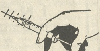
όλες τις κοινωνικές δυνάμεις σε πανεθνική κινητοποίηση κατά της μάστιγας.