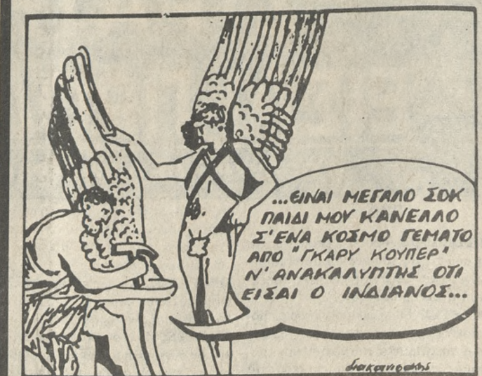
...ΕΙΝΑΙ ΜΕΓΑΛΟ ΣΟΚ ΠΑΙΔΙ ΜΟΥ ΚΑΝΕΛΛΟ Σ'ΕΝΑ ΚΟΣΜΟ ΓΕΜΑΤΟ ΑΠΟ ΓΚΑΡΥ ΚΟΥΠΕΡ ΑΠΟ Ν'ΑΝΑΚΛΑΥΤΗΣ ΟΤΙ ΕΙΣΑΙ Ο ΙΝΔΙΑΝΟΣ...