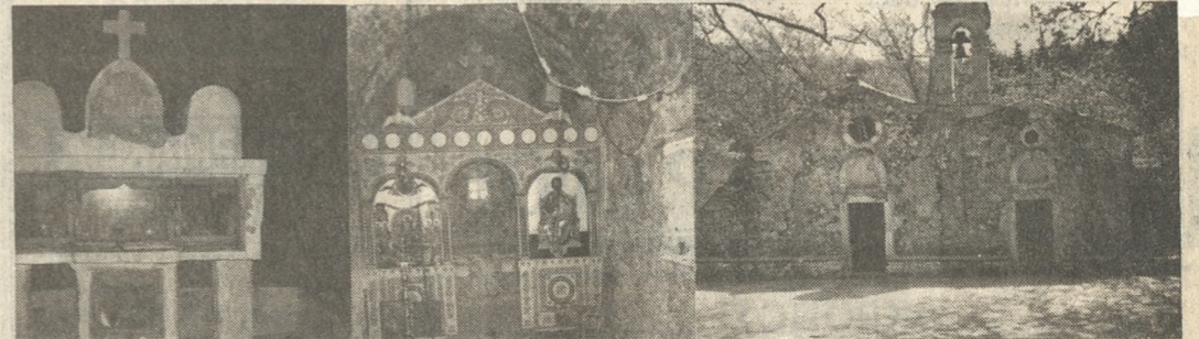
Φωτογραφίες από το φιλμ του τουρίστα που προκάλεσαν τον ενδιαφέρον των ανδρών της Ασφάλειας Ηρακλείου - Χανίων.

Το άτομο στην κατοχή του οποίου βρέθηκαν και το φιλμ και οι