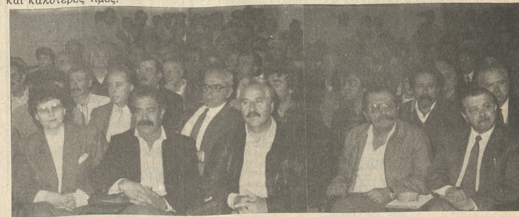
Από τη χθεσινή παγκρήτια σύσκεψη αγροτικών στελεχών στα γραφεία της ΕΑΣΗ.

«Ο φορέας εξαγωγής επιτραπέζιων όπως λειτουργήσει πρώτα δεν πρόκειται να λειτουργήσει πάλι, γιατί συμμετείχε το ελεύθερο εμπόριο με αποτέλεσμα να αυξάνονται τα κέρδη των εμπόρων και τα χρέη του δημοσίου. Μελετάται η δημιουργία νέου φορέα. Η