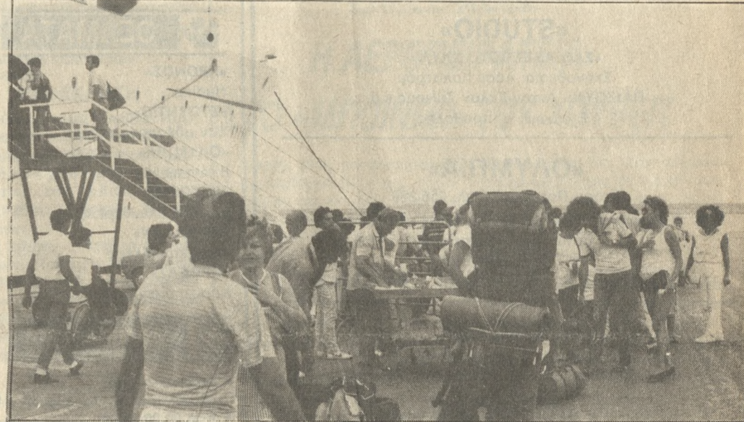
Ανυσιχεί τους τουριστικούς παράγοντες η αφύσικη ακύρωση των κρατήσεων.

Στο συμπέρασμα αυτό καταλήγουν τουριστικοί παράγοντες της Κρήτης οι οποίοι ενώ πριν μερικούς μήνες περίμεναν πως η φετινή περίοδος θα υπήρχε αύξηση της τάξης του 16-20%, σήμερα υπολογίζεται ότι η αύξηση αυτή θα κυμανθεί στα περιουσιακά επίπεδα και πάντως δεν πρόκειται να ξεπεράσει το 6-8%. Αιτία αυτού του γεγονότος είναι οι πολλές ακυρώσεις Άγγλων και Σκανδιναβών, που έγιναν μετά τις αυξήσεις των τιμών από τους τουριστικούς πράκτορες. Πάνω σ' αυτό το θέμα οι απόψεις του τουριστικού κυκλώματος είναι δισπασμένες. Ορισμένοι υποστηρίζουν ότι με την αύξηση και φέτος θα είναι μικρή, όμως θα έλθουν τουρίστες υψηλού οικονομικού επιπέδου που θ' αφήσουν αρκετά χρήματα, από την άλλη πλευρά υποστηρίζεται ότι δεν πρέπει μ' αυτό τον τρόπο ν' αποκλείονται οι τουρίστες χαμηλού οικονομικού επιπέδου γιατί αυτό είναι ένα αρνητικό στοιχείο για την αύξηση του τουριστικού ρεύματος προς την Κρήτη.