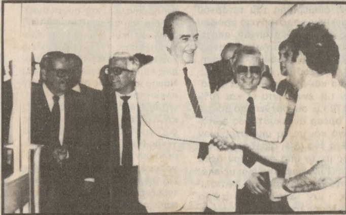
Ο κ. Μητσοτάκης προσέρχεται στο Πανεπιστήμιο

Δήλωση του αρχηγού της Ν.Δ. για το Πανεπιστημιακό