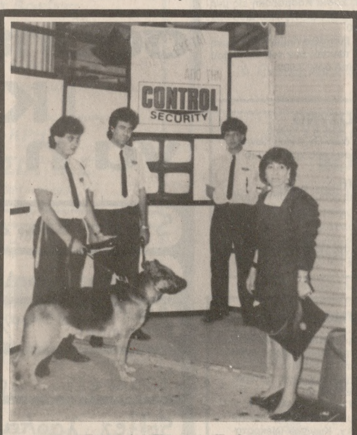
Στην 1η Γενική Έκθεση