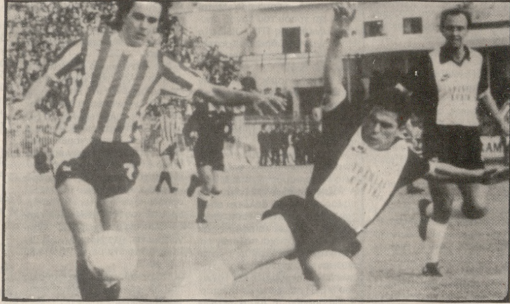
Φάση από τον πρώτο αγώνα του ΟΦΗ με τον Ολυμπιακό.