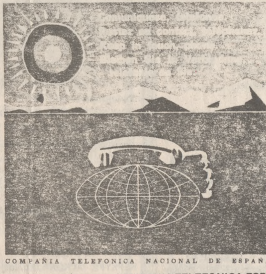
Το σημειωματάριο της COMPANIA TELEFONICA ESPANA.

Επιστολή του Επιχειρηματία κ. Νικ. Μεταξά στον υπουργό Μεταφορών και Επικοινωνιών κ.Κ.Μπαντουβά