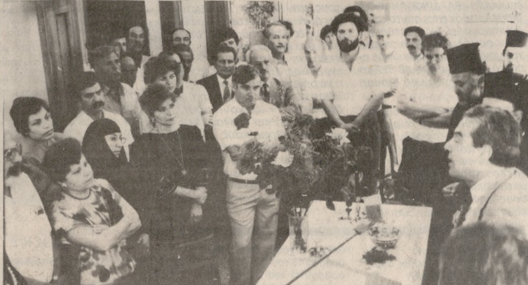
Στιγμιότυπο από τα χθεσινά εγκαινία του Κέντρου Επαγγελματικού Προσανατολισμού και Πληροφόρησης του ΟΑΕΔ.

Τα εγκαινία του Κέντρου Επαγγελματικού Προσανατολισμού και Πληροφόρησης του ΟΑΕΔ Ηρακλείου έγιναν χθές το πρωί παρουσία του Διοικητή του Οργανισμού κ. Τάσου Αμαλλού, της Νομάρχου κ. Χαράς Αθανασάκη-Μιχαηλίδου, υπηρεσιακών υπαλλήλων κ.α. Στην τελετή χοροστάσιο ο Σεβασμιότατος Αρχιεπίσκοπος Κρήτης κ. Τιμόθεος. ΠΛΗΡΟΦΟΡΗΣΗ ΓΙΑ ΚΑΘΕ ΕΠΑΓΓΕΛΜΑ Ο Οργανισμός Απασχόλησης Εργατικού Δυναμικού (ΟΑ.Ε.Δ) στα πλαίσια των δραστηριοτήτων που αναπτύσσει για την ενημέρωση των νέων στην περιφέρεια, σχετικά με την εκπαίδευση και τα επαγγέλματα ίδρυσε Κέντρο Επαγγ/κού Προσ/μού και Πληροφόρησης στο Ηράκλειο.