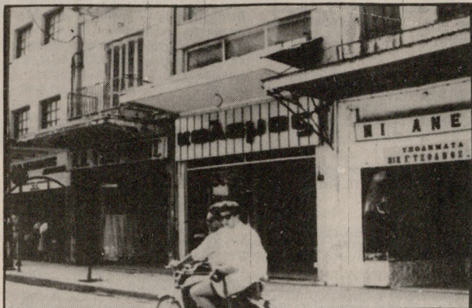
Κές για τον ίδιο τον κλάδο αλλά και γενικότερα για την αγορά του Ηρακλείου. Στη φωτογραφία οι δύο όψεις της αγοράς: Κλειστά και ανοικτά καταστήματα.

ΚΟΜΠΟΥΖΙΟ επικρατεί χθες στην αγορά της πόλης μας αφού όλα καταστήματα έμειναν κλειστά σε ένδειξη διαμαρτυρίας για το διογκούμενο παρεμπόριο ενώ άλλα άνοιξαν θεωρώντας θετικές τις ρυθμίσεις της Νομαρχίας και της Ν.Ε. Εμπορίου για το θέμα. Επίσης ο Εμπορικός Σύλλογος είχε αποφασίσει να αναβληθεί η εκδήλωση διαμαρτυρίας, όμως πολλοί έμποροι συμπαρασκευόμενοι στην απόφαση για κλείσιμο, που είχε πάρει ο Σύλλογος Εμπόρων Καταστηματαρχών, δεν άνοιξαν τα μαγαζιά τους. Πάντως οι εξελίξεις των τελευταίων ημερών στον Εμπορικό Σύλλογο, εν όψει μάλιστα των εκλογών των εργαζόμενων εβδομάδας, δεν μπορούν παρά να χαρακτηριστούν ανησυχητι-