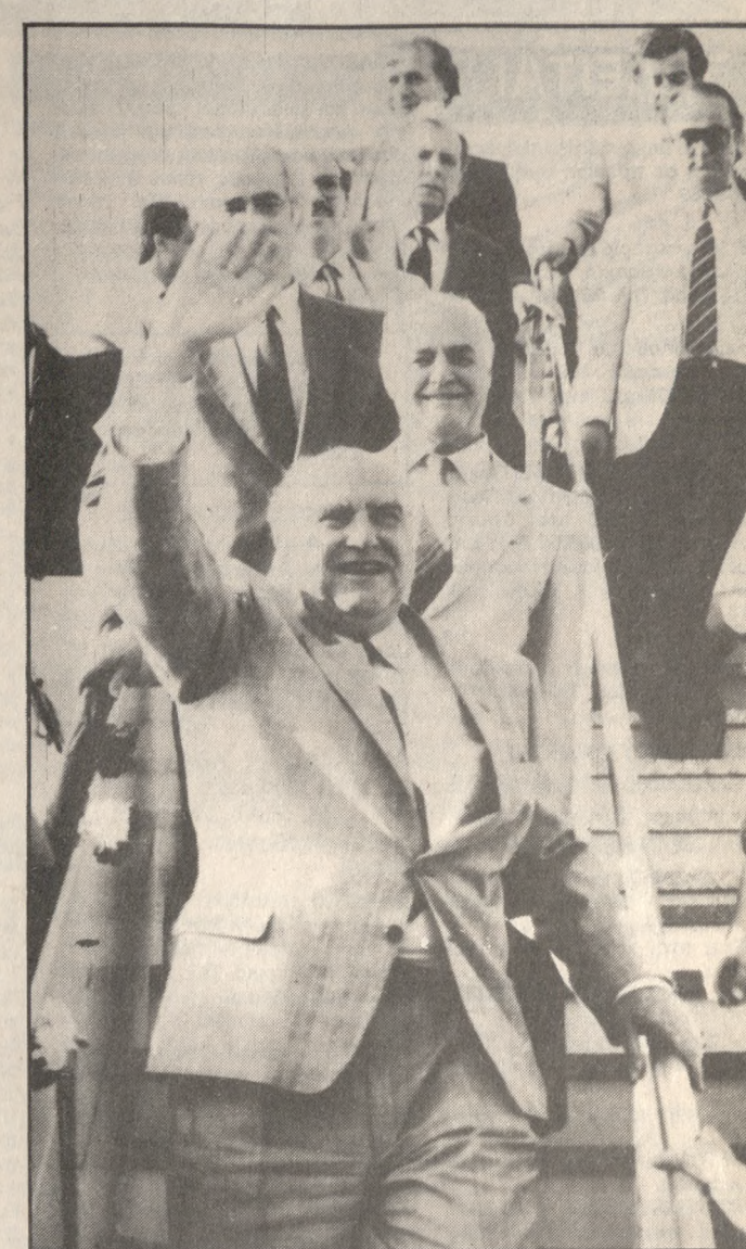
Οι έξι βάσεις περιορίζουν την Εθνική κυριαρχία. Και ο τόπος μας έχει ματώσει πολλές φορές για την ανεξαρτησία του. Ετσι για μας υπάρχει θέμα εθνικής υπερηφάνειας που δεν πρέπει να τρωθεί. Και αυτό είναι κάτι που πρέπει να καταλάβει η υπερδύναμη με την οποία συζητούμε το μέλλον της αμυντικής μας συνεργασίας όταν στις 31 Δεκεμβρίου του 1988 οι Αμερικανικές βάσεις θα πάψουν να έχουν νομική υπόσταση. Με αυτό το πνεύμα διαπραγματευόμαστε με στόχο την εξυπηρέτηση των υψίστων εθνικών μας συμφερόντων. Αν καταλήξουμε θα καλέσουμε τον Ελληνικό λαό να κρίνει τελικά αυτές με δημοψήφισμα. Θα δώσουμε στο λαό όλα τα στοιχεία... για να μπορέσει να κρίνει. Ο λαός θα έχει μπροστά του όλη την αλήθεια. Θα αποφασίσει κυριαρχία, σύμφωνα με την εθνική ευαισθησία και την δική του αντίληψη για τα εθνικά μας συμφέροντα. Ενώ ΠΑΣΟΚ δεν κρύβουμε την αλήθεια από το λαό. Υπηρετούμε τα ελληνικά συμφέροντα και μόνο αυτά. Για αυτό μπορούμε να ενημερώσουμε το λαό για τις μεγάλες εθνικές επιλογές. Οι σχέσεις μας με την Τουρκία. Η συνάντησή στο Νταβός. Τέτοιες επιλογές χρειάζεται να κάνουμε και στις σχέσεις μας απέναντι στην Τουρκία. Ετσι φτάσαμε στην συνάντησή με τον κύριο Οζάλ στο Νταβός της Ελβετίας και καταλήξαμε στην συμφωνία μας για μη πόλεμο. Ηταν μια αρχή. Ενα πρώτο θετικό βήμα. Το Νταβός το Κυπριακό και η εξέλιξη τους.

Τους καλούμε να προχωρήσουν σε γόνιμο διάλογο με συναίσθηση της κοινωνικής τους ευθύνης και της μορφωτικής τους αποστολής. Το ΠΑΣΟΚ το κόμμα της Αλλαγής αυτό θα οδηγήσει την πορεία του έθνους και στην νέα Αλλαγή. Το μέλλον του τόπου ξεπερνάει πια τα σύνορα του τόπου. Συναντιέται με το κοινό όλων των λαών της Ευρώπης. Μιας Ευρώπης ενιαίας δίχως σύνορα. Αυτή είναι η νέα εθνική προοπτάδα. Σε αυτή σας καλούμε.