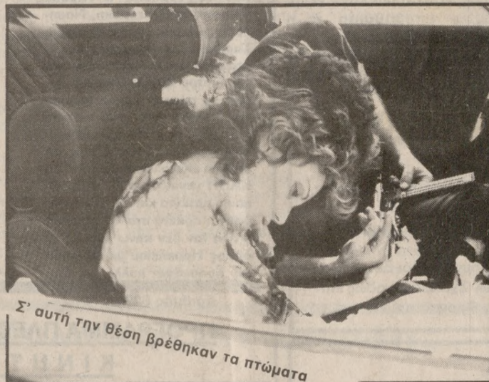
Σ' αυτή την θέση βρέθηκαν τα πτώματα