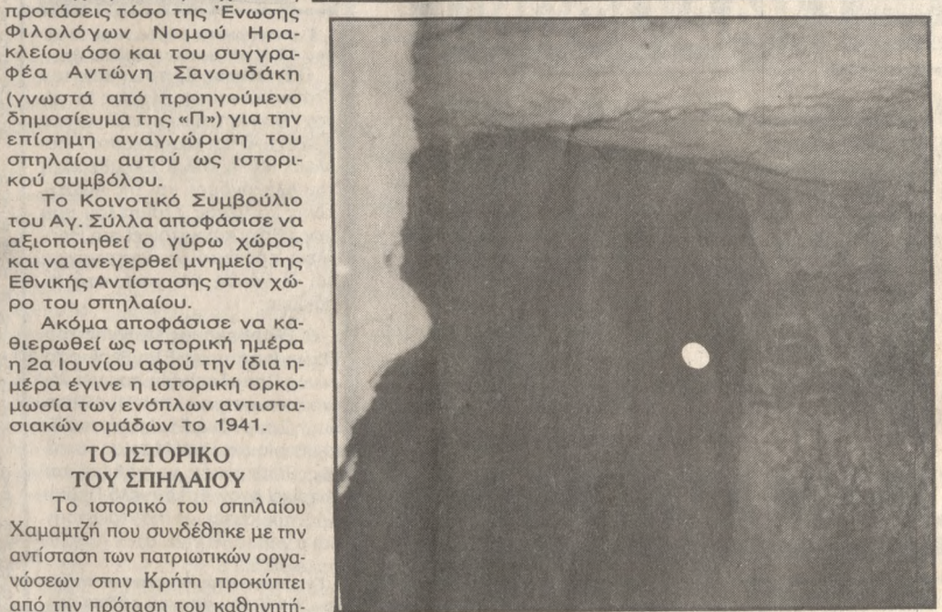
Το σπήλαιο Χαμαμτζή στον Αγ. Σύλλα

Σύλλα και στη σπηλιά του Χαμαμτζή είναι γνωστό πια στον ευρύτερο χώρο ότι ξεκίνησε η πρώτη ΕΝΟΠΙΑΗ και ΕΝΩΜΕΝΗ Αντίσταση ενάντια στους χιτλεροφασί-