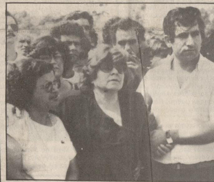
Συγγενείς των νεκρών θρηνούν στον τόπο της τραγωδίας.