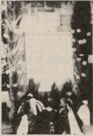
Στεφάνια στο μνημείο των εκτελεσθέντων στο Γάζι