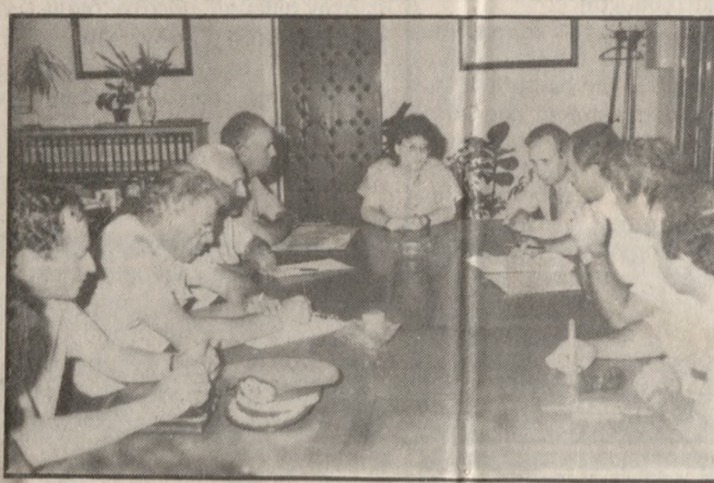
Από την χθεσινή σύσκεψη στη Νομαρχία για την αντιμετώπιση των πυρκαγιών