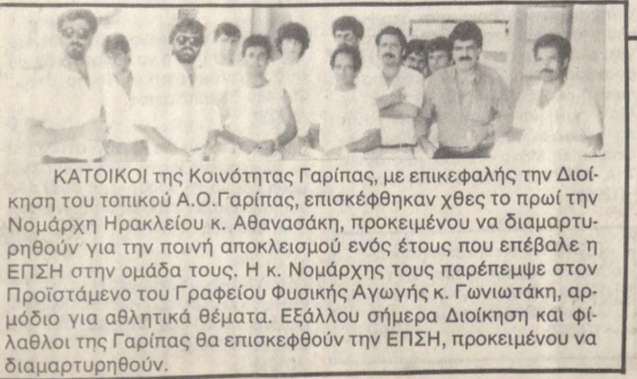
ΚΑΤΟΙΚΟΙ της Κοινότητας Γαρίτας, με επικεφαλής την Διοίκηση του τοπικού Α.Ο. Γαρίτας...