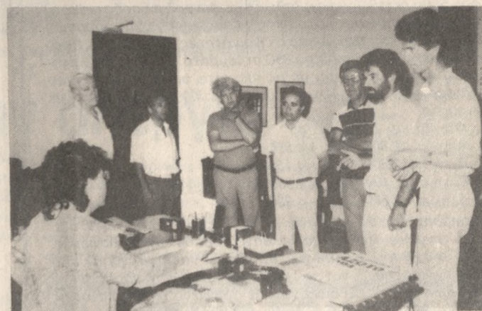
Αντιπροσωπεία του ΕΚΗ και των απεργών της Βάσης χθες στη Νομάρχη.