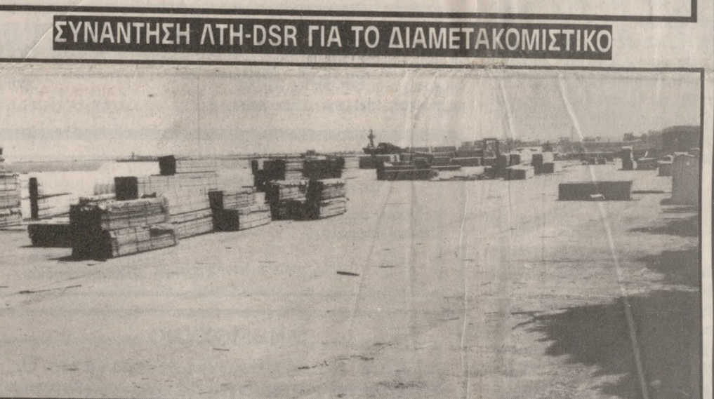
Ο χώρος της Ε.Ζ. Ηρακλείου. Πρώτος «πελάτης» φορτίο ξυλείας.

Αρχισε χθες το πρωί η λειτουργία της Ελεύθερης Ζώνης στο λιμάνι του Ηρακλείου. Τα πρώτα είδη που φυλάσσονται είναι ποσότητες ξυλείας, που άλωστε αναμένεται να είναι το 50% των προϊόντων που θα παραρμόνουν στο χώρο της Ε.Ζ.Η. «Η Ελεύθερη Ζώνη είναι ένας χώρος που κατά ένα γενικό τρόπο δεν θεωρείται Ελληνικός, με την έννοια ότι δεν υπάγεται σε τελωνειακές διατάξεις», είπε χθες στην «Π» ο Πρόεδρος του Λιμενικού Ταμείου κ. Μανώλης Καρακωνσταντάκης. «Με απλά λόγια, ο οποιοσδήποτε ενδιαφερόμενος μπορεί να αφήσει τα εμπορεύματα του στο χώρο πληρωθέντας ένα ποσό ως μίσθωμα, και να τα εκτελωνήσει όποτε θέλησει».