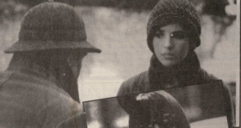
Σκηνή από το φιλμ «Κουαρτέτο»

ΘΑΥΜΑΣΙΕΣ ταινίες και μάλιστα μεγάλων σκηνοθετών, έχουμε την εβδομάδα αυτή. Παράλληλα πολύ καλοί είναι και οι ηθοποιοί που ερμηνεύουν όχι μόνο τους βασικούς αλλά και τους δευτερεύοντες ρόλους.