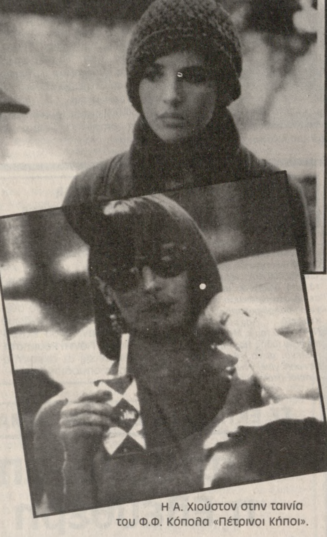
Η Α. Χιούστον στην ταινία του Φ.Φ. Κόπολα «Πέτρινοι Κήποι».

«ΠΑΛΛΑΣ» Κουαρτέρο «ΤΟΥΝΤΙΟ» Στην παγίδα του νόμου «ΟΡΦΕΑΣ» Πέρα από την έκσταση «ΓΑΛΛΕΙΑΣ» Πέτρινοι κήποι «ΡΟΜΑΝΤΙΚΑ» Το τελευταίο ταγκό στο Παρίσι «ΑΙΓΛΗ» Χάμπουργκερ Χιλ «ΑΜΟΡΕ» Ο εξολοθρευτής του Μαϊάμι