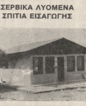
ΣΕΡΒΙΚΑ ΛΥΟΜΕΝΑ ΣΠΙΤΙΑ ΕΙΣΑΓΩΓΗΣ

Μ. Κατριάδης, Ευαγγελιστρίας 43 Η. Κουζούλογλου, Παπαναστασίου 146