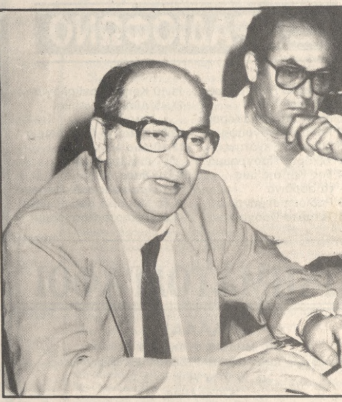
Ο Διοικητής του ΙΚΑ κ. Φοίβος Ιωαννίδης.

ΥΠΑΡΧΟΥΝ ΠΡΟΒΛΗΜΑΤΑ ΣΤΗΝ ΕΙΣΠΡΑΞΗ Ωστόσο ο κ. Ιωαννίδης παραδέχθηκε χθες ότι στον αφορά τις επιχειρήσεις του ιδιωτικού το-