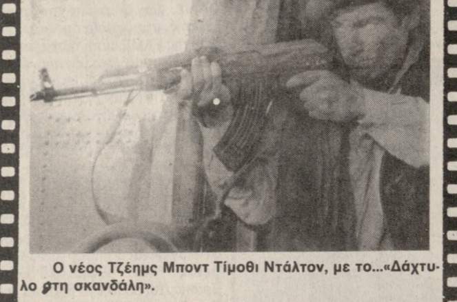
Ο νέος Τζέιμς Μποντ Τίμοθι Ντάλτον, με το...«Δάκτυλο στη σκανδαλή».