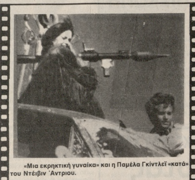
«Μια εκρηκτική γυναίκα» και η Παμέλα Γκίντι «κατά» του Ντέιβιν Άντριου.

«ΚΑΥΤΑ ΠΑΙΧΝΙΔΙΑ» Τολμηρή έγχρωμη διεθνούς παραγωγής. ΤΟ φιλμ απευθύνεται στους φίλους του είδους. Οι σκηνές του είναι αρκετά τολμηρές, ενώ υπάρχουν και μερικά εντυπωσιακά εξωτερικά πλάνα. (ΟΡΦΕΑΣ)