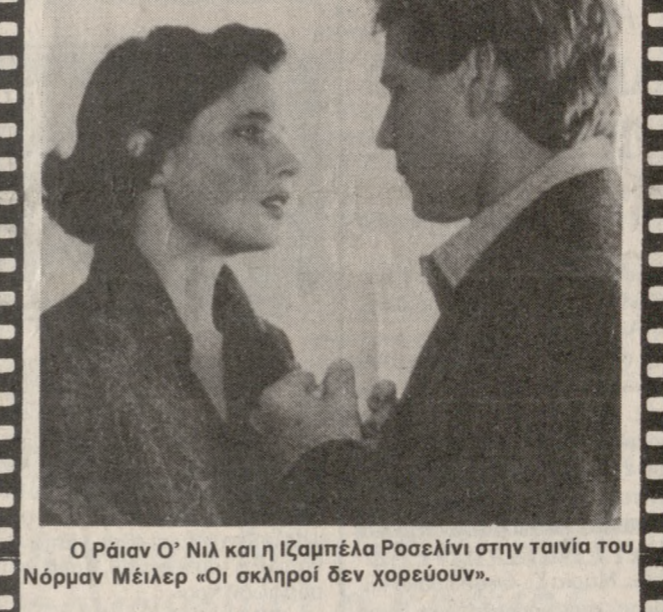
Ο Ράιαν Ο' Νιλ και η Ιζαμπέλα Ροσελίνι στην ταινία του Νόρμαν Μείλερ «Οι σκληροί δεν χορεύουν».