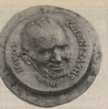
Πέντε χρόνια συμπληρώθηκαν από την ίδρυση στους Βαρβάρους του Μουσείου Ν. Καζαντζάκη. Ο Ιδρυτής του, σκηνογράφος και ενδυματολόγος