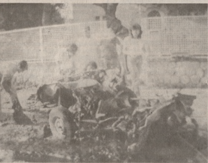
Το αυτοκίνητο του ναυτικού Ακόλουθου της Πρεσβείας των ΗΠΑ μετά την τρομακτική έκρηξη

*Άγνωστοι δράστες δολοφόνησαν χθές στις 8.10 το πρωί στο Κεφαλάρι της Κηφισιάς τον αμερικανό στρατιωτικό και ναυτικό ακόλουθο πλοίαρχο Ουίλλιαμ Νορτνιν. Οι άγνωστοι είχαν παγιδεύσει αυτοκίνητο σταθμευμένο στον αριθμό 76 της οδού Δεληγιάννη που βρίσκεται στην διασταύρωση της με την οδό Γούναρη. Το θύμα έμεινε στην οδό Δεληγιάννη στον αριθμό 80-82.