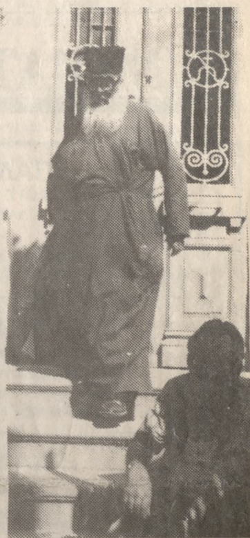
«Κανονιοποιημένος» Αρχιμανδρίτης αφού έβαλε το λουκέτο ετοιμάζεται να φύγει.