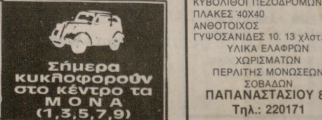
Σήμερα κυκλοφορούν στο κέντρο τα ΜΟΝΑ (1,3,5,7,9)

Την εγγονή μου Αριστέα Γαβαλά που πήρε το δίπλωμα της Γαλλικής Φιλολογίας του Πανεπιστημίου Θεσσαλονίκης συγχαίρω θερμά και της εύχομαι καλή σταδιοδρομία. Η γιαγιά της Αριστέα Παπαδοπούλη