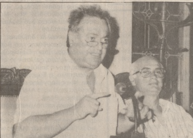
Ο Δήμαρχος και ο πρόεδρος του Δημοτικού Συμβουλίου στη χθεσινή συνεδρίαση.