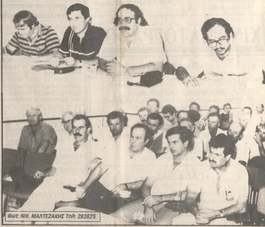
Φωτ: ΝΙΚ. ΜΑΛΤΕΖΑΚΗΣ Τηλ: 282625

της για τον πολλαπλασιασμό των τρομοκρατικών ενεργειών, οι οποίες αποτελούν μάστιγα για τον διεθνή τουρισμό. Απευθύνει έκκληση στη διεθνή κοινότητα να καταπολεμήσει την τρομοκρατία και να ενισχύσει τα εναντίον της μέτρα.