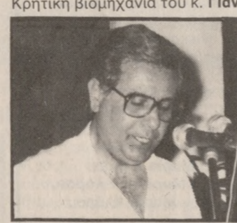
Από τη χθεσινή εκδήλωση στο εργοστάσιο των πλαστικών Κρήτης