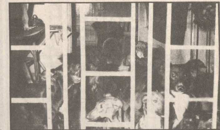
Σκυλιά κλεισμένα στο σπίτι-φυλακή