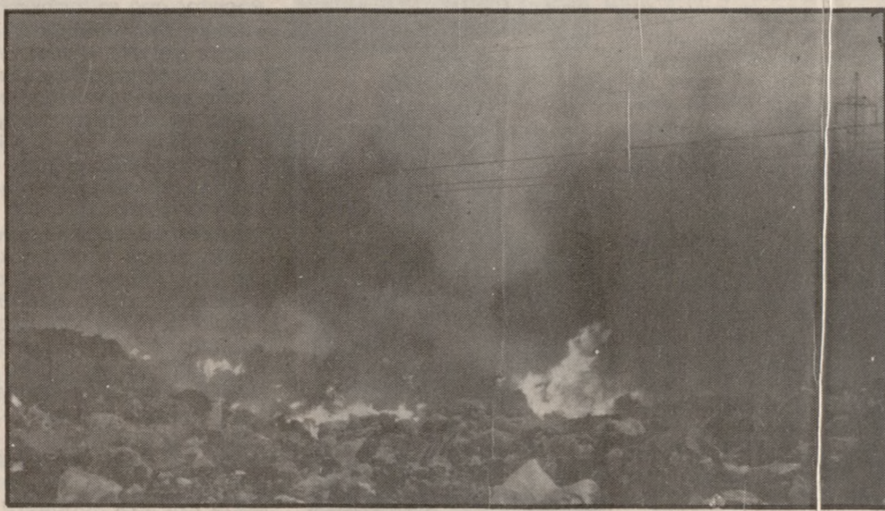
Απο σκοπιδοτόπους ξεκίνησαν οι περισσότερες πυρκαγιές

«Κάνουμε έκκληση στους εκπαιδευτικούς του Ο.Τ.Α.», λέει ο κ. Τζιμούρτος να πάρουν μέτρα ώστε να μειωθούν ή και να μηδενιστούν οι κίνδυνοι από τους σκοπιδοτόπους. Είναι κάτι που μπορεί να επιτευχθεί».