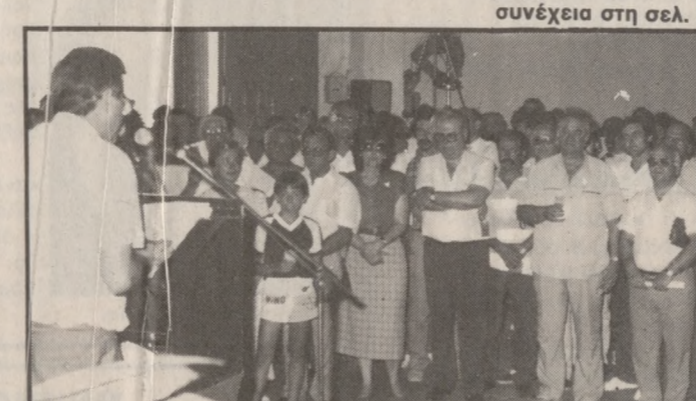
Από τη χθεσινή εκδήλωση στο εργοστάσιο των πλαστικών Κρήτης

ρη τήρηση των προδιαγραφών. «Εξοικονόμηση πρώτης ύλης και ενέργειας. «Ευκόλια χειρισμού της γραμμής, καλύτερη εποπτεία, περιορισμός ανθρώπινων λαθών.