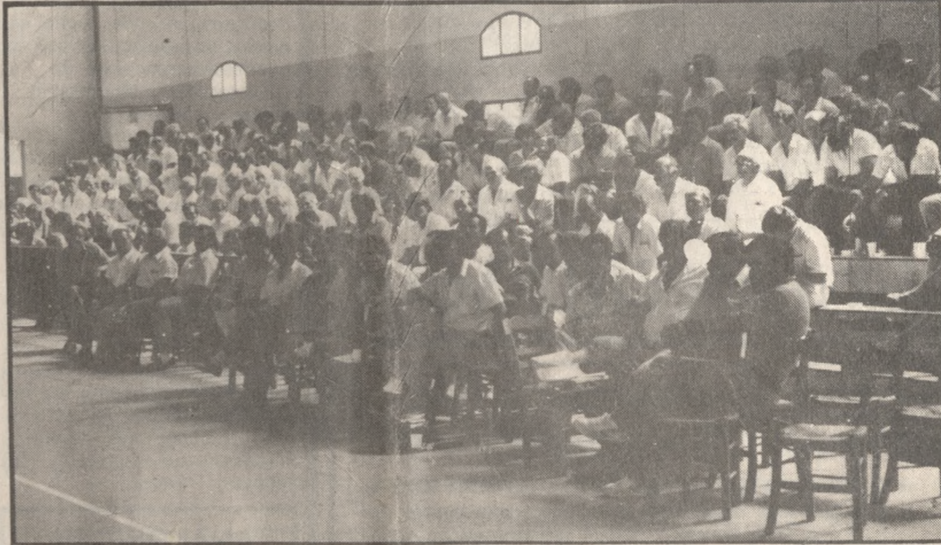
Από την σύσκεψη στις Αρχάνες.

της ΕΟΚ να γίνει προγραμματισμός με βάση τόσο τις εδαφοκλιματολογικές συνθήκες όσο και τη δυνατότητα απορρόφησης των νέων προϊόντων στην αγορά. Για να μη φθάσουν οι αγρότες να πετούν τα προϊόντα των νέων καλλιεργειών όπως είπε χαρακτηριστικά ο εκπρόσωπος της Ένωσης Αγροτικών Συνεταιρισμών Κορίνθου. Μιλώντας στη διάρκεια της σύσκεψης τόνισε ότι φύτεψαν πολλοί παραγωγοί βερύκκα αντί αμπέλια και μετά από 4-5 χρόνια αναγκάζονται να τα θάβουν στις χωματέρες. Ο πρόεδρος της ΓΕΣΑΕ Βασίλης Ζαρκινός στην παρέμβαση του σημείωσε πως η γενική τάση που επικρατεί στην ΕΟΚ είναι η μειώ-