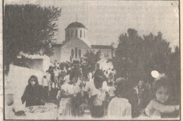
Πλήθος κόσμου και εφέτος στην Αγ. Μαρίνα της Βόνης.

Κάθε προηγούμενο Επέερασε εφέτος η προσέλευση κόσμου στην εορτή της Αγ. Μαρίας στην Βόνη Πεδιάδος. Είναι χαρακτηριστικό ότι ακόμα και με τους πιο συντηρητικούς υπολογισμούς, υπολογίζεται ότι πάνω από 130.000 άτομα συμμετείχαν στον εορτασμό της Αγίας. Πρέπει να σημειωθεί ότι εφέτος είχαν ληφθεί μέτρα για την εξυπηρέτηση των προσκυνητών. Αντίστοιχη ήταν η ανταπόκριση του κόσμου στον εορτασμό της μνήμης της Αγίας στην εκκλησία της Αγίας Μαρίας στο μετόχι Τσαλακιάς έδω από το Ηράκλειο, καθώς και στα Καμίνια.