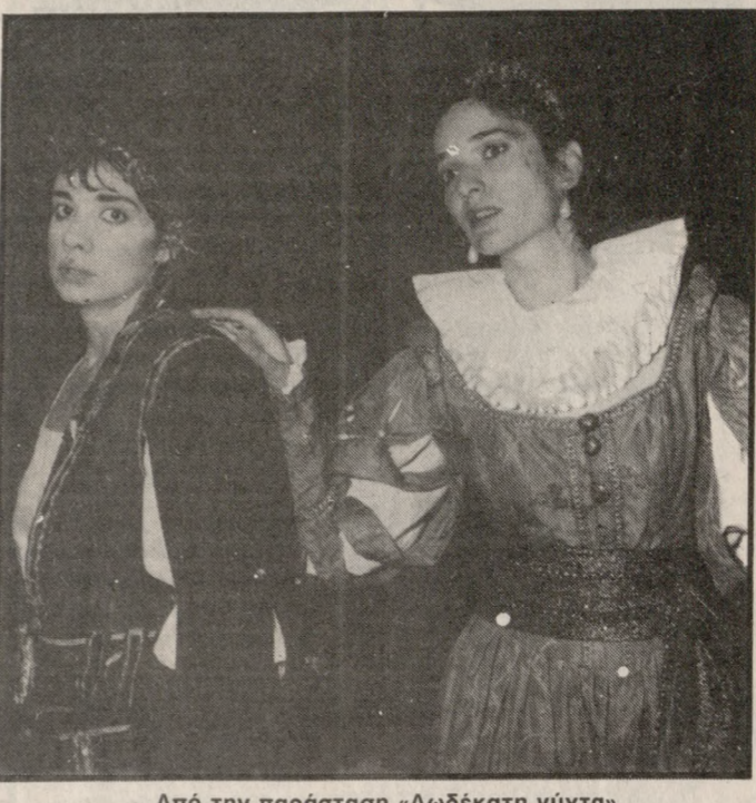
Από την παράσταση «Δωδέκατη νύχτα».

ΠΟΛΙΤΙΣΤΙΚΕΣ εκδηλώσεις διοργανώνει η Κοινότητα Χερσονήσου με την επωνυμία «Χερσονήσος Καλοκαίρι 1988». ■ Σύμφωνα με το πρόγραμμα οι εκδηλώσεις θα γίνουν: ΠΡΟΓΡΑΜΜΑ ΕΚΔΗΛΩΣΕΩΝ ΤΕΤΑΡΤΗ 3 ΑΥΓΟΥΣΤΟΥ 1988 «Παιδαγωγική σκηνή Τζέιν Φατίου»: Το Μαγικό πέτρινο λουλούδι, Λαϊκό Ρώσικο παραμύθι Ε. Αζακοφ. Σκηνοθεσία: Αλέξης Μίγκας