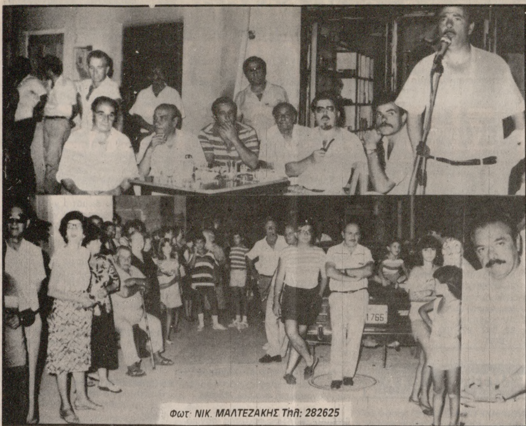
Φωτ. ΝΙΚ. ΜΑΛΤΕΖΑΚΗΣ Τηλ. 282625