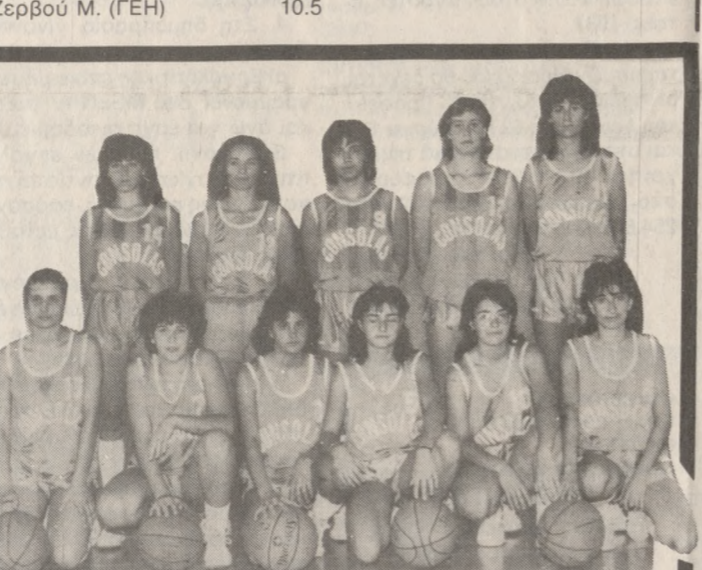
Η ομάδα μπάσκετ νεανίδων του Ηρόδοτου. Από τις παίκτριες αυτές δεν μετέχουν οι Γεωργιλοδάκη, Καταλαγαριανού και Περσολάκη.