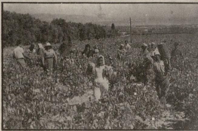
Αγωνιστικά διεκδικούν οι αγρότες τη διασφάλιση των σταφυλιών.

BALENTINO Καινούργια ενοικιαζόμενα επιπλωμένα διαμερίσματα στο πανέμορφο ΜΠΑΛΙ κοντά στη θάλασσα ιδανικά για οικογένειες. Όλα τα διαμερίσματα διαθέτουν πολύ μεγάλα βεράντα με φανταστική θέα προς την θάλασσα. Για επικοινωνία στο τηλ. 256.350 ΔΕΥΤΕΡΑ και ΠΕΜΠΤΗ ώρα 5-8μμ. ΔΗΜ. ΦΡΑΓΚΙΟΥΔΑΚΗ