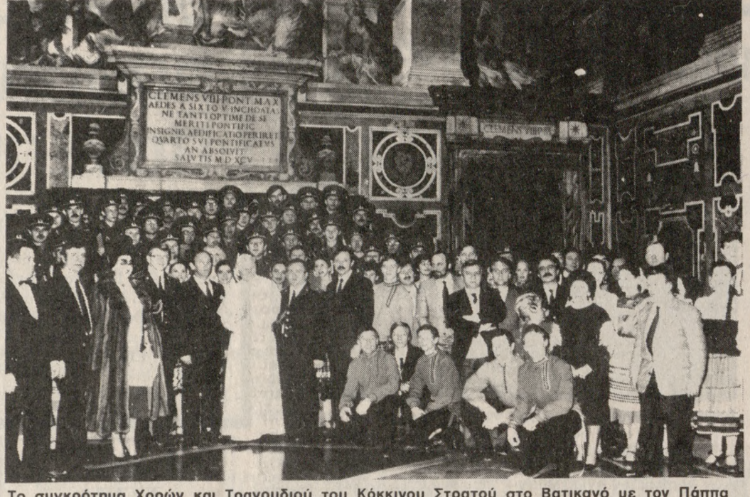
Το συγκρότημα Χορών και Τραγουδιού του Κόκκινου Στρατού στο Βατικανό με τον Πάπα Ιωάννη-Παύλο.