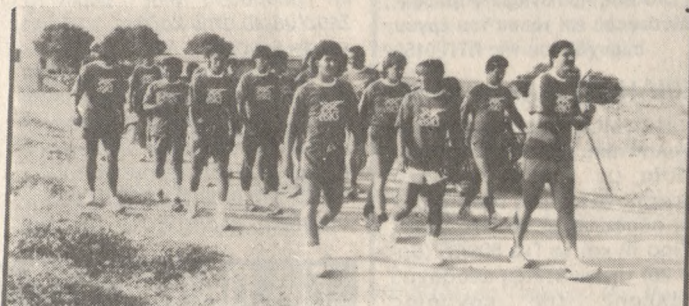
Οι ποδοσφαιριστές του ΟΦΗ σε πρόσφατη προπόνηση