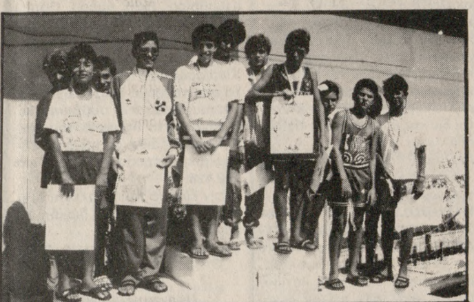
Μερικοί από τους κολυμβητές που πήραν μετάλλιο στους αγώνες που έγιναν στην πόλη μας.