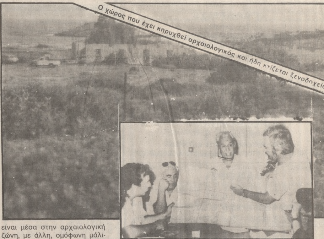
Ο χώρος που έχει κηρυχθεί αρχαιολογικός και ήδη κτίζεται ξενοδοχείο