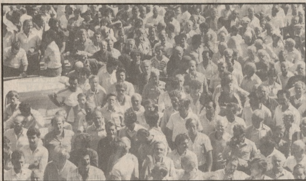
Κατακλύζουν πάλι την πλατεία Ελευθερίας οι παραγωγοί

Χθες κλιμάκιο της Ομοσπονδίας Αγροτικών Συλλόγων, των