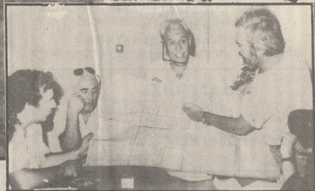
Από τη χθεσινή συνέντευξη τύπου.

είναι μέσα στην αρχαιολογική ζώνη, με άλλα, ομόφωνα μάλιστα, απόφαση του έδωσε άδεια σε ιδιωτική εταιρία να ανεγείρει ξενοδοχειακή μονάδα και ιδιωτικό βιολογικό καθαρισμό! Τη διακρίση σε βάρος των φορέων της Τοπικής Αυτοδιοίκησης και σε ό-