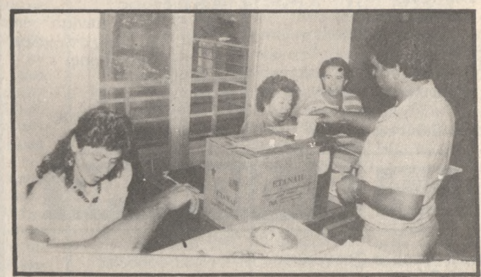
Από τις εκλογές στην Ομοσπονδία Επαγγελματιοβιοτεχνών.

Η παράταξη της «Δημοκρατικής Συνεργασίας» κέρδισε τις 6 από τις 11 έδρες του νέου διοικητικού συμβουλίου της Ομοσπονδίας Επαγγελματιών και Βιοτεχνών νομού Ηρακλείου, στη διάρκεια των χθεσινών εκλογών. Το ψηφοδέλτιο της προτίμησης 26 αντιπροσώπων των επαγγελματιοβιοτεχνικών σωματείων ενώ το συνδυασμό