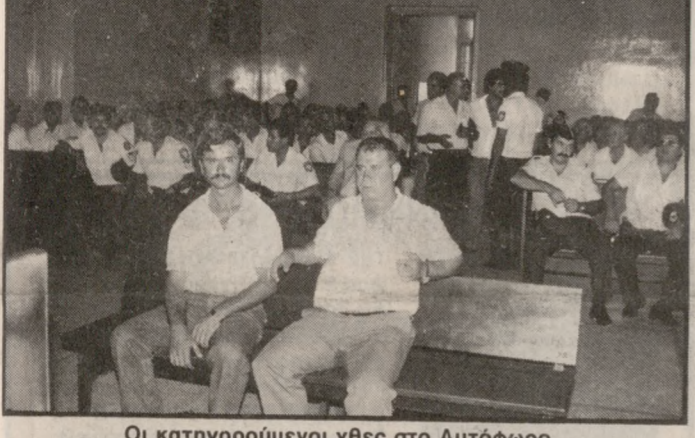
Οι κατηγορούμενοι χθες στο Αυτόφωρο.

ράκης που ήταν ανάμεσα σε αυτούς που συνελθάν τους δύο κατηγορούμενους. Η διαδικασία ξεκίνησε στις 12 το μεσημέρι και πρώτοι μάρτυρες κατέθεσαν οι αστυφύ-