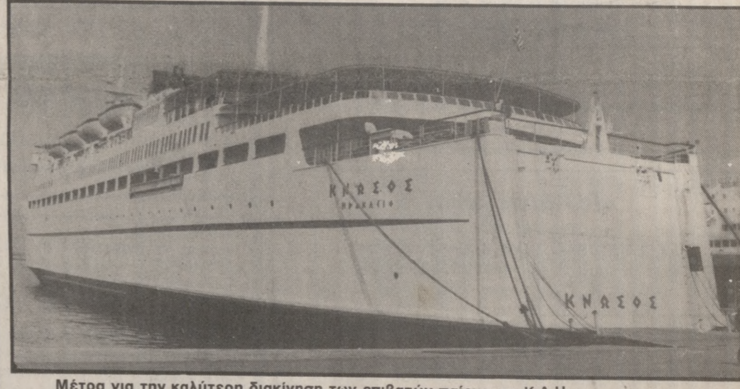
Μέτρα για την καλύτερη διακίνηση των επιβατών παίρνει το Κ.Λ.Η.