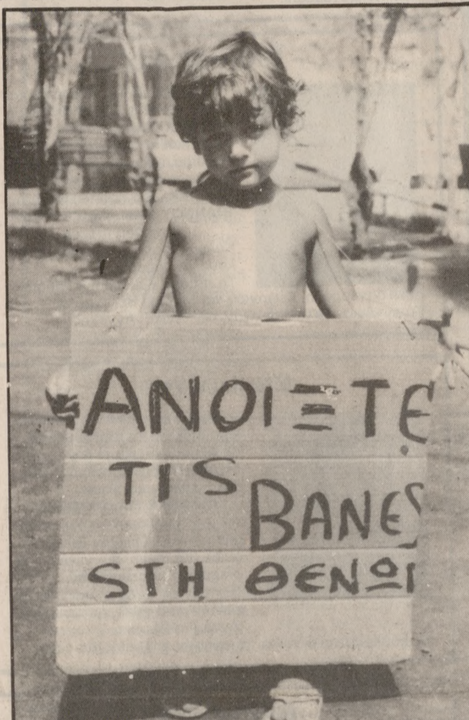
Στιγμιότυπο από την πρόσφατη κινητοποίηση των κατοίκων της πόλης για την ύδρευση