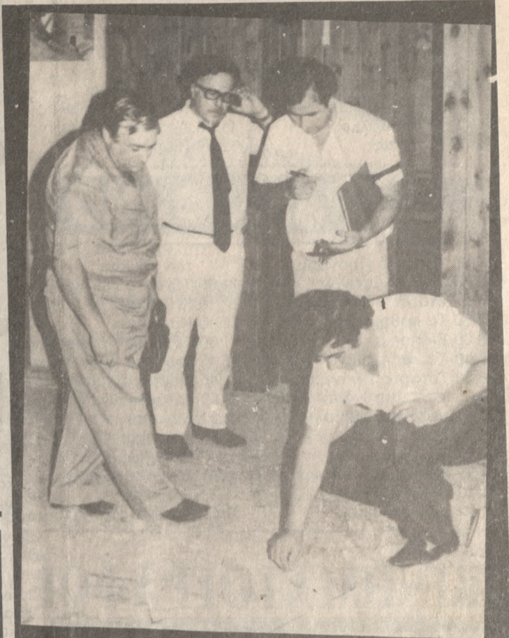
Άνδρες της ασφάλειας και πυροτεχνουργοί ερευνούν τον χώρο του κτιρίου.

συνέχεια στη σελ. 3 ΦΩΤΟΡΕΠΟΡΤΑΖ ΝΙΚΟΣ ΜΑΛΤΕΖΑΚΗΣ ΤΗΛ. 282625