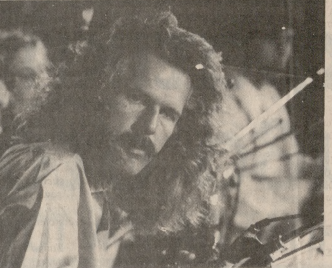
Ο Daly Ross που εμφανίζεται στη συναυλία στ' Ανώγεια

Με την υπ' αριθ. ΕΜ. 4746/17-8-88 απόφαση της Νομ. Ηρακλείου, που ισχύει από 18-8-88, καθορίστηκε όπως η Λαϊκή Αγορά περιοχής Δειλινών θα λειτουργεί στο εξής κάθε Πέμπτη αντί Σαββάτου και η Λαϊκή Αγορά Πόρου θα λειτουργεί στο εξής στους χώρους που λειτουργεί μέχρι σήμερα κάθε Σάββατο αντί Πέμπτης.