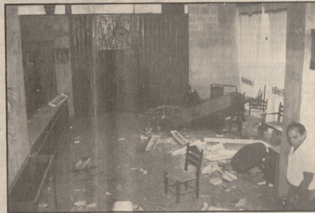
Το εσωτερικό του κτιρίου του ΕΟΤ μετά την έκρηξη.

σε εντολή για την άμεση αποκατάσταση των ζημιών του κτιρίου από ειδικό συνεργείο του ΕΟΤ με στόχο την ταχύτερη επαναλειτουργία του.