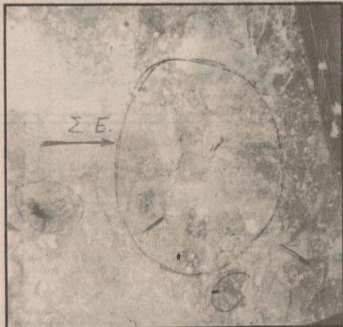
Το σημείο της έκρηξης εντός του κτιρίου όπως το σημείωσαν οι αξιωματικοί της εγκληματολογικής υπηρεσίας.