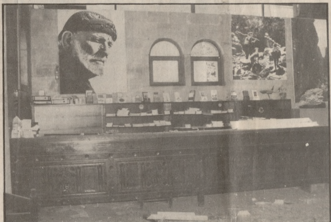
Το ένα από τα δύο παράθυρα έσπασε ο δράστης για να πετάξει την σωλήνα-βόμβα στο εσωτερικό της αίθουσας υποδοχής των γραφείων του ΕΟΤ

στον Υπουργό Δημόσιας Τάξης, που, αντί να ενισχύσει το Αστυνομικό Τμήμα Ηρακλείου με προσωπικό, πληροφορηθήκαμε σήμερα, ότι αποδυναμώνεται η δύναμη του με την απόσπαση μέτρους από την ελληνική υπάρχουσα δύναμη στην Αθήνα.