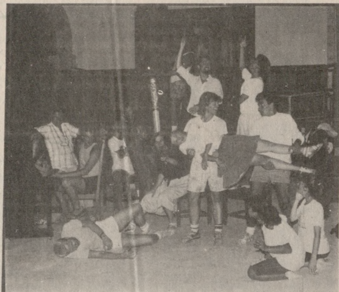
Απο την πρόβα των συντελεστών της παράστασης

Το μιούζικαλ που έχει σημειώσει το μεγαλύτερο αριθμό παραστάσεων στην Αμερική και 20 άλλες χώρες, το περίφημο ΦΑΝΤΑΣΤΙΚΕΣ παρουσιάζεται και απόψε στο Μικρό Δημοτικό Κηποδέατρο μέσα στα πλαίσια του φεστιβάλ «ΗΡΑΚΛΕΙΟ-ΚΑΛΟΚΑΙΡΙ 88». Η παράσταση του ΦΑΝΤΑΣΤΙΚΗΣ που προετοιμάζεται στην Αμερική, Αθήνα και Ηράκλειο τώρα και μήνες, δίδεται εδώ από μουσικό συγκρότημα της γνωστής μας Ορχήστρας ΑΛΕΑ ΙΙΙ της Βοστώνης με τη διεύθυνση του ΘΟΔΩΡΟΥ ΑΝΤΩΝΙΟΥ και ομάδα ηθοποιών, τραγουδιστών, χορευτών από την Αμερική.