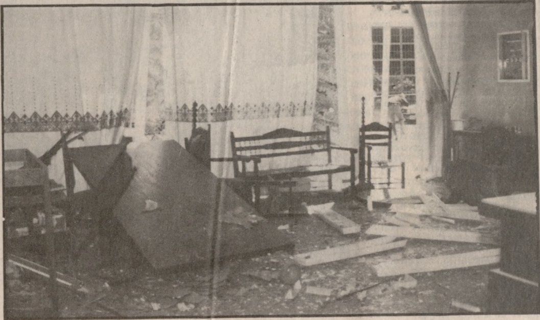
Εικόνα καταστροφής στο κτίριο του ΕΟΤ.

ΣΧΕΤΙΚΟ ΜΕ ΤΟ ΧΤΥΠΗΜΑ ΣΤΗΝ ΑΣΦΑΛΕΙΑ Παράλληλα, όπως δήλωσε από την πρώτη στιγμή ο Αστυνομικός Διευθυντής