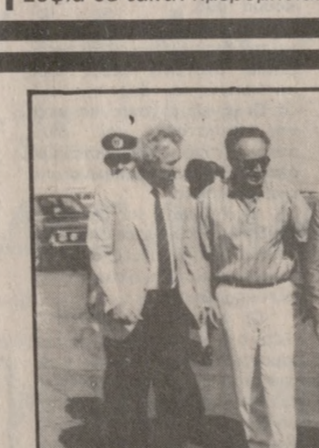
Από την χθεσινή άφιξη του κ. Ν. Σκουλά, στο Ηράκλειο.

ΤΗΝ πληροφορία επιβεβαίωσε ο κυβερνητικός εκπρόσωπος Σωτήρης Κωστόπουλος απαντώντας σε ερώτηση δημοσιογράφων με αφορμή σχετικό δημοσίευμα, διευκρινίζοντας ότι η επίσημη ανακοίνωση της επίσκεψης θα εκδοθεί από κοινό όπως συνήθιζατε στην Αθήνα και τη Σόφια σε τακτή ημερομηνία.