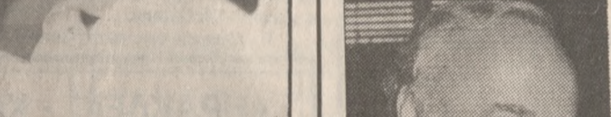
κόν κ. Κάρλος Παπούλιας που πραγματοποιεί επίσημη επίσκεψη στην Κύπρο προσκεκλημένος του Κύπριου ομόλογου του κ. Γ. Ιακώβου.

Συνμιλήσει για τις τελευταίες εξελίξεις του Κυπριακού, ιδιαίτερα μετά τη συνάντηση της Γενεύης, θα έχει απο σήμερα στη Λευκωσία ο υπουργός Εξωτερικών