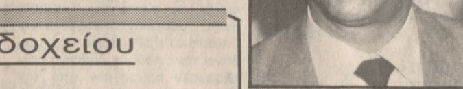
πρόσωποι φορέων, όπως είναι του Εμπορικού Συλλόγου, φέρονται αποφασισμένοι να θέσουν προς συζήτηση το θέμα της αντικειμενικής αξίας, σημειώνοντας παράλληλα ότι η αφιλοεπιστημική αύξηση θα δημιουργήσει τεράστια προβλήματα

Αυτό πάντως που αναμένεται να κυριαρχήσει στην αυριανή συνάντηση είναι η τελευταία αύξηση μέχρι 90% της τιμής της αντικειμενικής