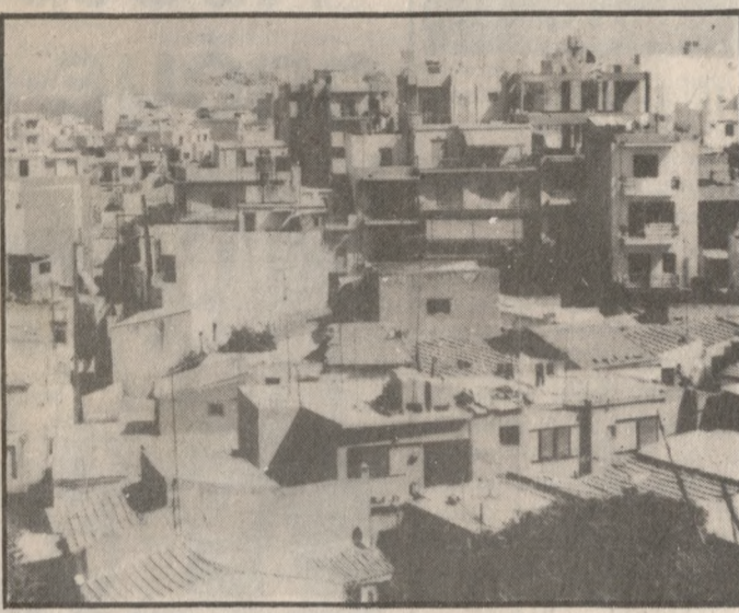
Διαφωνίες για τις αυξήσεις - φωτιά, στις τιμές της αντικειμενικής αξίας των ακινήτων του Ηρακλείου, θα τεθούν αύριο στη συσκέψη με τον υπουργό Οικονομικών.

Αυτό πάντως που αναμένεται να κυριαρχήσει στην αυριανή συνάντηση είναι η τελευταία αύξηση μέχρι 90% της τιμής της αντικειμενικής