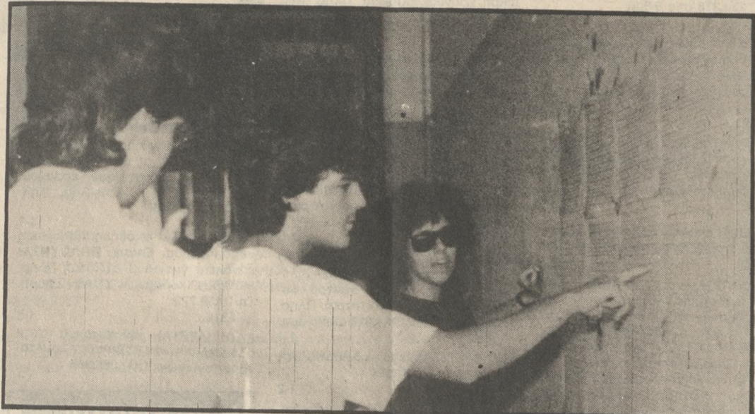
Συνέχεια από τη σελ. 1