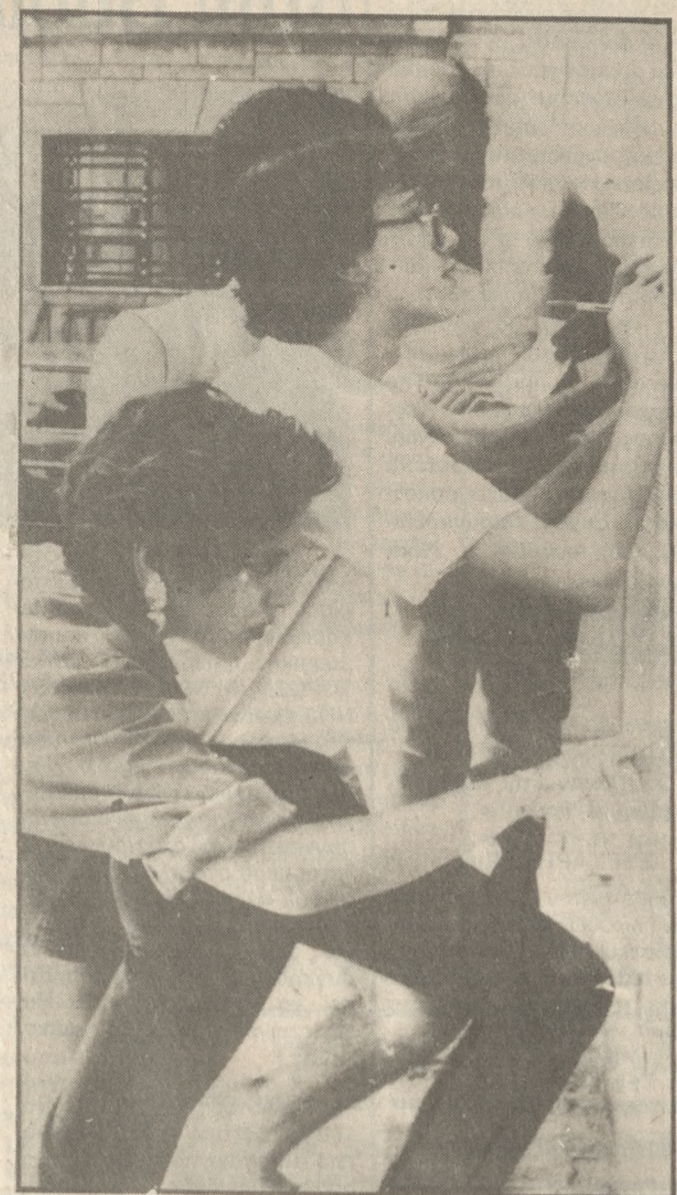
Έληξε χτες η περίοδος αγωνίας για τους υποψηφίους της Τριτοβάθμιας Εκπαίδευσης καθώς ήδη από σήμερα όλοι θα ξέρουν για τον απέναντι ή όχι σε μια από τις σχολές των ΑΕΙ και ΤΕΙ.