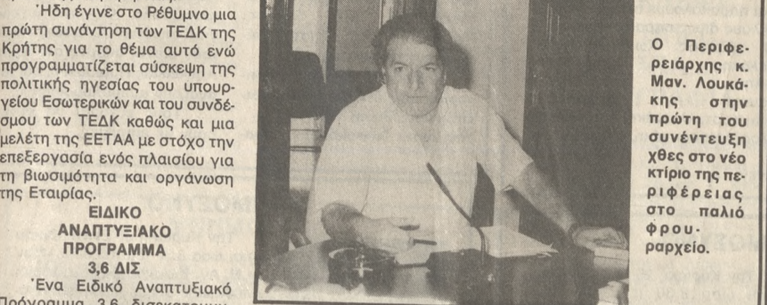
Ο Περιφερειάρχης κ. Μαν. Λουκάκης στην πρώτη του συνέντευξη χθες στο νέο κτίριο της περιφέρειας στο παλιό φρουραρχείο.

Εταιρία Ανάπτυξης Κρήτης, που θα λειτουργεί με ιδιωτικο-κοινωνικά κριτήρια, βρίσκεται στα «αρχαία». Φορέας της υπο ίδρυση εταιρίας, είτε χθες στους δημοσιογράφους ο Γενικός Γραμματέας της Περιφέρειας Κρήτης κ. Μανώλης Λουκάκης θα είναι οι Οργανισμοί Τοπικής Αυτοδιοίκησης, οι Συνεταιρισμοί, τα Επιμελητήρια και οι Τράπεζες. Η δραστηριότητα της θα έχει στόχο τη συγκρότηση μιας οργανωμένης αναπτυξιακής προσπάθειας, που θα κινηθεί στα πλαίσια των συμπερασμάτων του πρόφοτου αναπτυξιακού συνεδρίου της Περιφέρειας. Ήδη έγινε στο Ρέθυμνο μια πρώτη συνάντηση των ΤΕΔΚ της Κρήτης για το θέμα αυτό ενώ προγραμματίζεται σύσκεψη της πολιτικής ηγεσίας του υπουργείου Εσωτερικών και του συνδέσμου των ΤΕΔΚ καθώς και μια μελέτη της ΕΕΤΑΑ με στόχο την επεξεργασία ενός πλαισίου για τη βιωσιμότητα και οργάνωση της Εταιρίας. ΕΙΔΙΚΟ ΑΝΑΠΤΥΞΙΑΚΟ ΠΡΟΓΡΑΜΜΑ 3,6 ΔΙΣ Ένα Ειδικό Αναπτυξιακό Πρόγραμμα 3,6 δισεκατομμυρίων δραχμών, που αφορά τους ΟΤΑ της Κρήτης εκπονείται από την 1η Ιανουαρίου με διάρκεια 3 χρόνων. Το πρόγραμμα αυτό, που είναι στο Πρότυπο του ΜΟΠ,