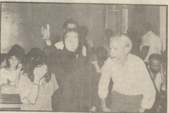
Οι γονείς του θύματος διαμαρτύρονται για την απόφαση