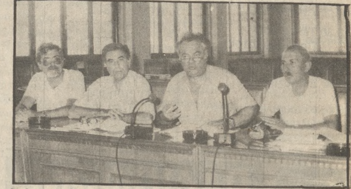
Από τη συνέντευξη τύπου για την ανακοίνωση της πρότασης της Επιτροπής Προγραμματισμού του Δήμου.

Την Τρίτη το βράδυ θα συνεδριάσει το Δημοτικό Συμβούλιο για να συζητήσει και να ψηφίσει το Τεχνικό Πρόγραμμα Έργων του 1989, την πρόταση για το οποίο παρουσίασε ήδη η αρμόδια δημοτική επιτροπή. Όπως έγραψε η «Π», το συνολικό ύψος του προγράμματος είναι 1 δις 825.300.000 δρχ.