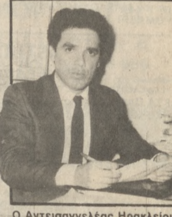
Ο Αντεισαγγελέας Ηρακλείου κ. Ν. Καρπέτας.

Ποινική δίωξη για απείθεια σε νόμιμη πρόσκληση Αρχής και άρνηση αποδοχής διαχειριστικού ελέγχου, άσκησε χθες ο αντεισαγγελέας Πλημμελειοδικών Ηρακλείου κ. Νικ. Καρπέτας κατά του Μητροπολίτη Ιεραπόστολου κ. Σητείας Φιλόθεου. Ο αντεισαγγελέας Ηρακλείου προχώρησε στην άσκηση ποινικής δίωξης μετά από επείγον έγγραφο της επιθεώρησης Δημοσίων Διαχειρίσεων στο οποίο αναφέρεται ότι ο Μητροπολίτης Φιλόθεος αρνήθηκε να παραδώσει στον επιθεωρητή της 9ης επιθεώρησης Δημοσίων Διαχειρίσεων κ. Αντ. Ραμουτσάκη τα διαχειριστικά βιβλία και λοιπά στοιχεία, όταν μάλιστα η συγκεκριμένη Μητρόπολη, δεν ελέγχθηκε τα τελευταία δέκα χρόνια για χρήματα ή υλικό που ανήκουν στο Δημόσιο.