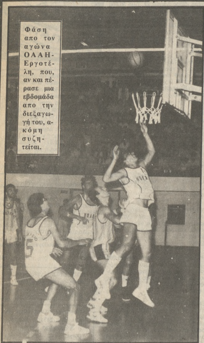
Φάση από τον αγώνα ΟΑΑΗ-Εργοτέλη, που, αν και πέρασε μια εβδομάδα από την διεξαγωγή του, ακόμη συζητείται.