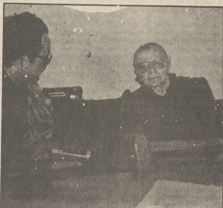
Η Έλλη Αλεξίου με τον συντάκτη μας Γιώργο Λαγουβαρδό

Σεμνή, ολόσμενη ήρθε η Έλλη Αλεξίου στην πόλη μας. Στην πόλη του Μεγάλου Κάστρου. Εδώ που πρωτοσυνάντησε το φως. Ήρθε μας τίμησε με την επιθλιπτική παρουσία της και τιμήθηκε από το Λαό μας. Φεύγοντας