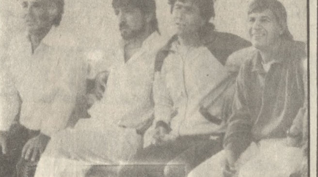
Ο κ. Ναλαμπάντης (δεξιά) για πρώτη φορά στον πάγκο της ομάδας της Αλικαρνασσο

ΚΟΒΗΣ (Παναρκαδικός): «Θέλαμε τον βαθμό της ισοπαλίας και τον πήραμε. Το γήπεδο είναι πολύ καλό και δεν ευνοεί τον Ηρόδοτο που παίζει δυνατά και όχι τεχνικά».