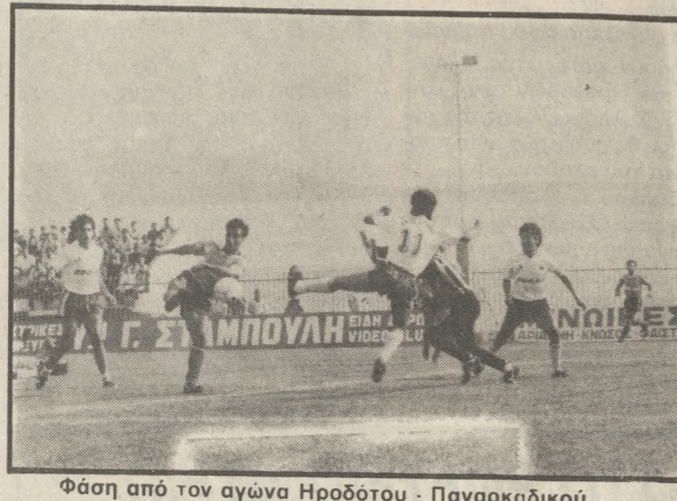
Φάση από τον αγώνα Ηρόδοτος - Παναρκαδικός