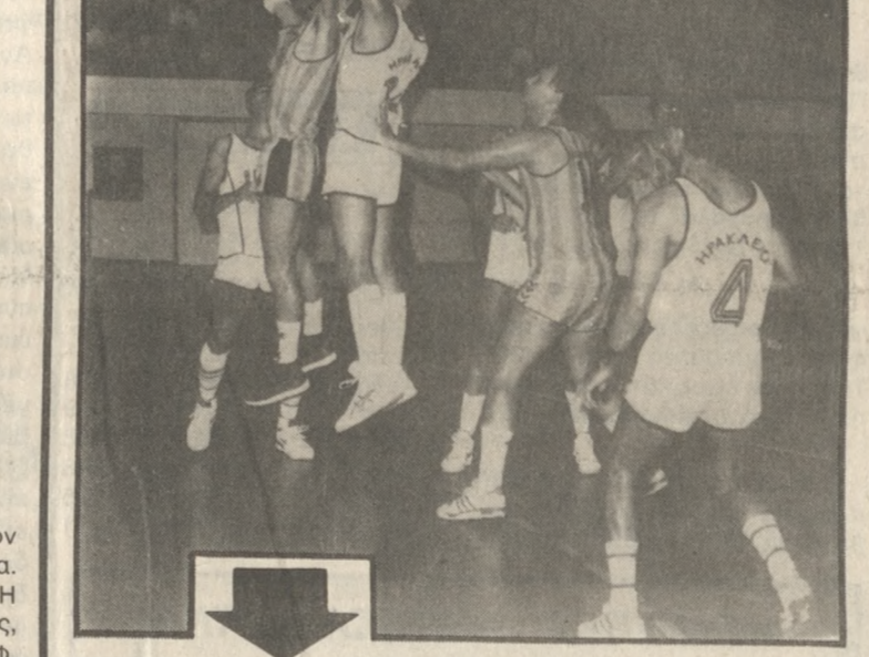
Στην 3η αγωνιστική της Α' Κατηγορίας Μπάσκετ