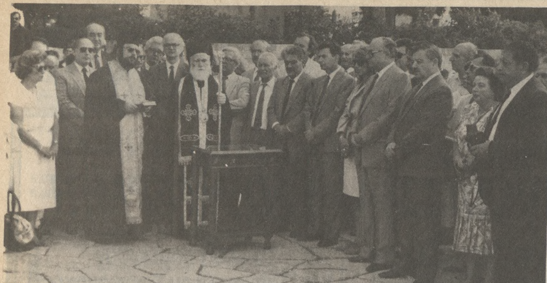
Οι εκπρόσωποι της Πολιτείας, των Κομμάτων, και Σύνοδοι, στο Τριάγιο στους τάφους των Βενιζέλων.