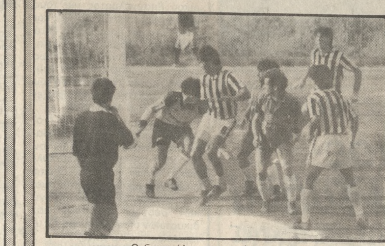
Ο Εργοτέλης προηγείται στο σκορ