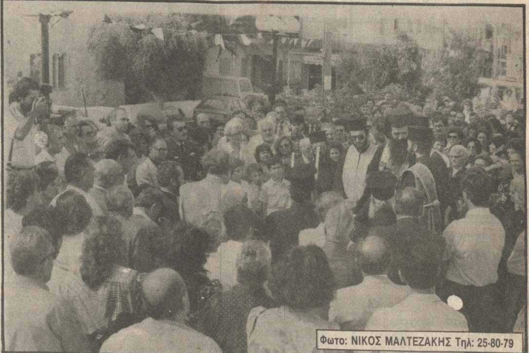
Φωτο: ΝΙΚΟΣ ΜΑΛΤΕΖΑΚΗΣ Τηλ: 25-80-79

Όπως εξάλλου ανακάλυψε ο κυβερνητικός εκπρόσωπος κ. Κωστόπουλος, στον πρωθυπουργό έστειλε τηλεγράφημα και ο Οικουμενικός Πατριάρχης Δημήτριος. Στο τηλεγράφημα εκφράζει εγκάρδιος χαριετισμός και ευχές για γρήγορη αποθεραπεία για να συνεχίσει να προσφέρει τις πολυτιμες υπηρεσίες του στο Έθνος.