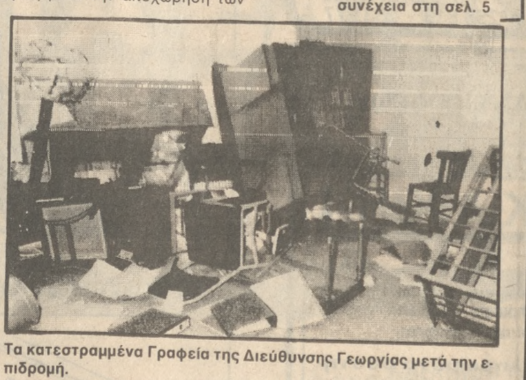
Τα κατεστραμμένα Γραφεία της Διεύθυνσης Γεωργίας μετά την επιδρομή.