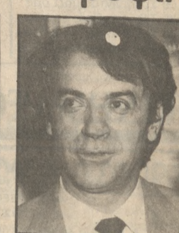
Δεν έπαισε για τις καλές προθέσεις του στο Οικονομικό.

Η επιστημοποίηση του αναμενόμενου ανασχηματισμού έγινε χθές από το Λονδίνο δια στόματος Μαρούδα ο οποίος σ' ερώτηση εαν πρόκειται να γίνει Κυβερνητικός ανασχηματισμός απάντησε: «μπορεί πιθανώς να γίνουν μια έως δύο μετακινήσεις υπουργών όχι όμως ανασχηματισμός».