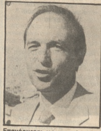
Επανέρχεται ως ισχυρός στην κυβέρνηση. Φέρεται εκφραστής του Ευρωπαϊκού προφίλ.