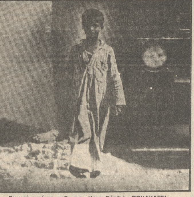
Σκηνή από το φιλμ του Κοντ Ρέτζιο «ΠΟΥΚΑΤΣΙ»

ΣΕΡΒΙΚΑ ΛΥΜΕΝΑ ΣΠΙΤΙΑ ΕΙΣΑΓΩΓΗΣ Εγγύηση μιας ζωής. Ομομόνωση ηχομόνωση 1/2% παραπάνω από διεθνή Στάνταρ Εξωτερικό τοίχωμα 14 πόντων. Αντισεισμικά. Καλύτερες και υγιεινότερες συνθήκες ζωής. Κάλυψη εσωτερικά με γυψοσανίδες που αντέχουν (σε περίπτωση πυρκαγιάς) 600 βαθμούς Κελσίου. Εισάγονται επί τη βάση των εμπνευματικών ανταλλαγών και συμφέρουν. Συνιστώνται δε σε υπέρ κλιματολογικές συνθήκες και σεισμολογικές περιοχές. ΚΑΤΕΡΙΝΑ ΜΑΤΘΑΙΑΚΗ Α. ΚΑΛΟΚΑΙΡΙΝΟΥ 214 ΤΗΛ: 282 919, 227 355