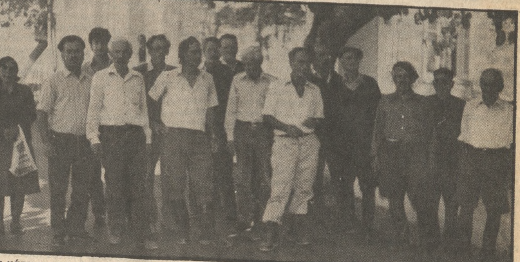
Οι κάτοικοι του Λουτρακίου της Βιάννου έτοιμοι να υπερασπισθούν το νερό που όμως τους περισσεύει.