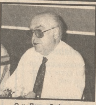
Ο κ. Παναγιάς

«Το προσεχές Σάββατο στις 4 το απόγευμα ο Πρωθυπουργός κ. Α. Παναγιάς επιστρέφει στην Αθήνα όπου και θα αναλάβει πλήρως και σε όλη τους την έκταση τα καθήκοντά του». Την επίσημη αυτή ανακοίνωση έκανε χθες το μεσημέρι ο Κυβερνητικός εκπρόσωπος Σωτήρης Κουτσόγιωργας απαντώντας σε ερώτηση για την ημερομηνία επιστροφής του Πρωθυπουργού και για το πότε θα αρχίσει να εργάζεται κανονικά. «Οι συμβουλές των γιατρών,