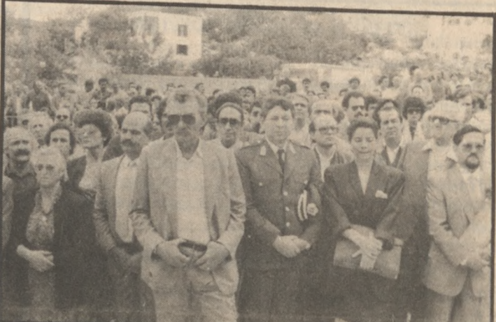
Πλήθος κόσμου στα αποκαλυπτήρια.

«Τέσσερα χρόνια πέρασαν από το θάνατο σου, και όμως το όνομά σου θα ζει και μνημονεύεται καθημερινά από όλους τους Έλληνες και ιδιαίτερα από τους Ρεβενιώτες. Με σεβασμό, ευλάβεια θανάσιμης πίστης και λατρεία αειμνήστου ΠΑΥΛΟΥ, πολιτική ιδιοφυΐα, βγαλμένος από το πολιτικό εργαστήριο του αειμνήστου Σοφοκλή Βενιζέλου το εργαστήρι του μέτρου και της ισορροπίας με ξεκά-