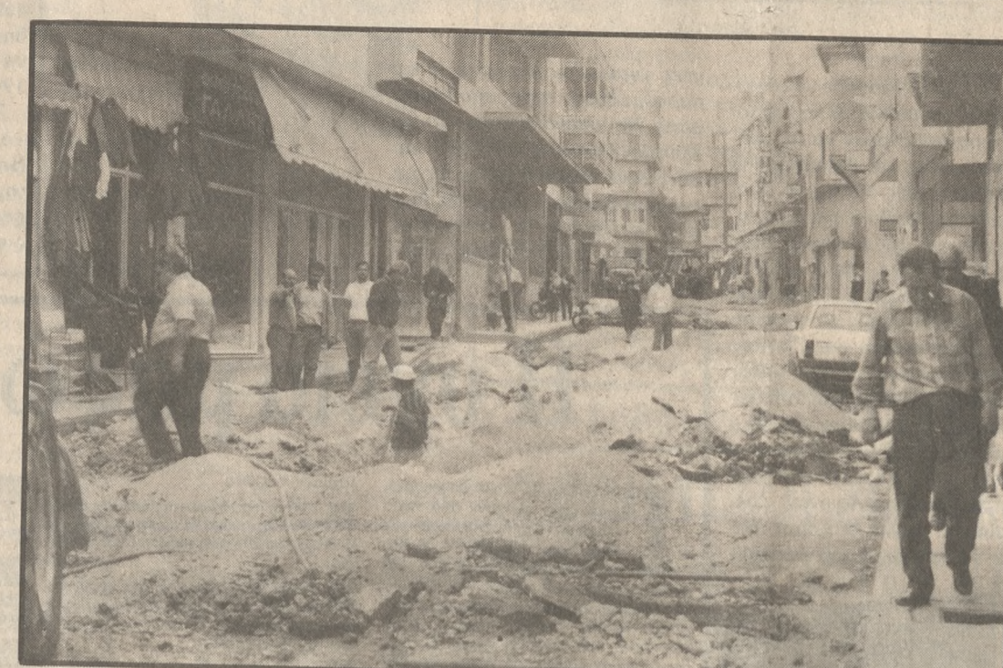
Χθεσινή φωτογραφία από την δεύτερη μέρα σε λίγες μέρες ανασκαφή που γίνεται στην οδό Αγίου Μηνά.

δεν κάνουν ούτε σεφτέ... Ο κ. Μακατούνης συμφώνησε ότι υπάρχει μια καλύτερη λύση στα έργα, που δημιουργεί προβλήματα στην αγορά, γι' αυτό και συμφωνήσε να καθορίζονται από κοινού με τους εμπόρους οι ημερομηνίες έναρξης τους. Αυτό ιδιαίτερα θα ισχύσει στην περίπτωση της οδού της Καλοκαιρινού. Ένα έργο που, όπως είπε ο κ. Μακατούνης, θα κρατήσει περίπου 4 μήνες και έχει ήδη δημιουργηθεί πρόβλημα για καιρό στα καταστήματα. — Να υπάρξει συγχρονισμός των παράλληλων έργων με ΔΕΗ και ΟΤΕ. Ο κ. Μακατούνης είπε ότι